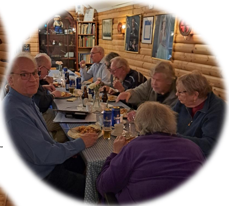
... medan resten av gänget redan hunnit huggit in på maten