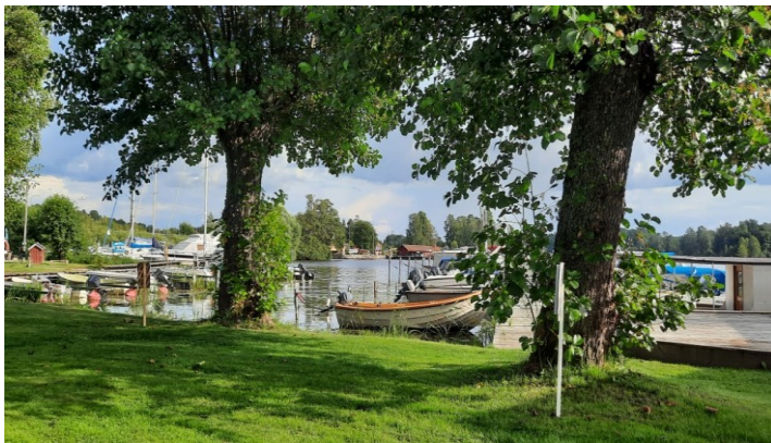
Vy över Borgåsund