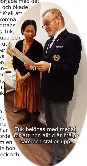
Tuk belönas med medalj för att hon alltid är hjälpsam och ställer upp.