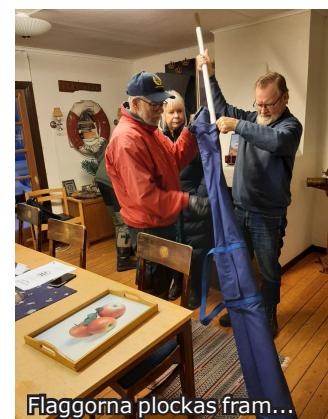
Flaggorna plockas fram...

Höstens flaggvaktskurs genomfördes enligt plan med tre eftermiddagsträffar ute i Marinstugan. Förutom oss i Flaggvaktsgruppen deltog sex intresserade medlemmar vid alla tre, eller vid två eller ett tillfälle, beroende på hur det passade. Det blev många frågor, intressanta diskussioner och flaggvakterna fick berätta om sina upplevelser och om vad det hela går ut på.