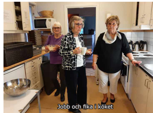
Jobb och fika i köket

Nästa svaghetsperiod kom ju 1991 när Sovjetunionen upplöstes. Vid denna senaste förlust för Ryssland så gjorde de närmaste gränsstaterna försök att göra sig fria igen. Ryssland var då svagt igen och då bestämde sig Ukraina för att nu är vi ett eget land, som balterna gjorde, så då var Ukraina fritt. Men ryssarna säger fortfarande att Ukraina tillhörde Ryssland från 1654. Ryssarna menar även att Ukraina har varit ryskt ända sedan vi i Sverige fick Skåne vid den tiden.