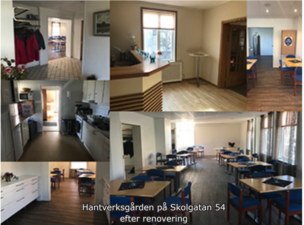
Hantverksgården på Skolgatan 54 efter renovering