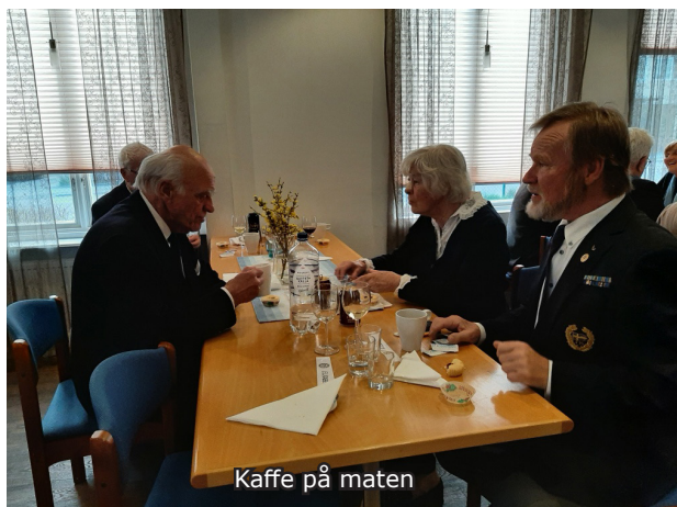
Kaffe på maten

Som ni vet så är ju Ryssland världens största land till ytan. Det kanske inte var så stort då furstendömet startades i Moskva 1283 och som omvandlades till Tsarryssland 1547 fram till 1721.