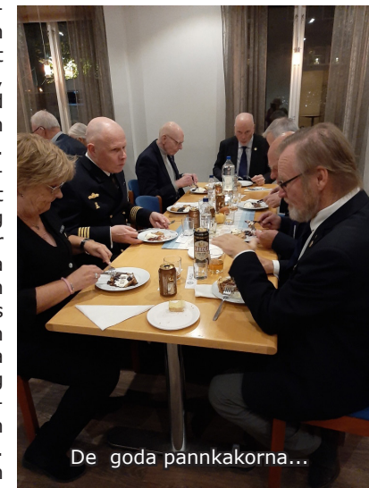
De goda pannkakorna...