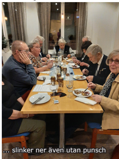
... slinker ner även utan punsch

Många av våra medlemmar har ju arbetat på Musköbasen, så denna uppdatering om den utveckling som pågått och pågår där var naturligtvis välkommen. Styrelsen i FM Nynäshamn hade planer på att försöka ordna ett besök på Musköbasen under hösten, men fick veta