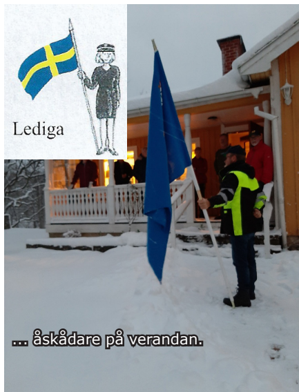
... åskådare på verandan.

haft roligt och trevligt tillsammans så gav kursen ett gott resultat för FM Nynäshamns Flaggvaksgrupp.