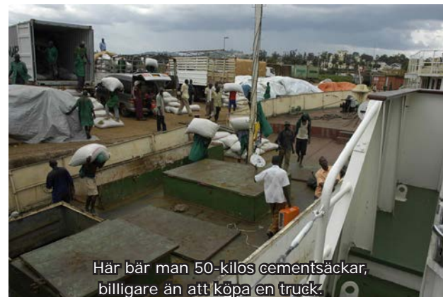
Här bär man 50-kilos cementsäckar, billigare än att köpa en truck.

Mindre och lättare cementsäckar på 30 kg, lastade på Euro-pallar och lyftes på och av lastbilen med truck. Pallarna skulle inplastas mot regn/vatten från sjön. - Truck skulle då lasta av pallarna antingen in i magasinet i Mwansa eller direkt ombord på lämpliga lastfartyg som fanns i Lake Vic.