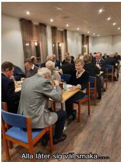
Alla låter sig väl smaka.....