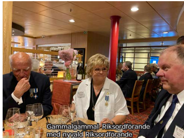
Gammalgammal Riksordförande med nyvald Riksordförande

Tidigt startade vi upp projektet. Vi satte oss ned och gick igenom hur mötet skulle genomföras, vilka åtgärder som vi ville förbättra som vid tidigare riksårsmöten inte fungerat så bra och hur kunde vi göra vårt riksårsmöte ännu bättre. Vi lade ner mycket jobb på anmälningar från deltagare ute från lokalföreningarna vilket var det största jobbet att