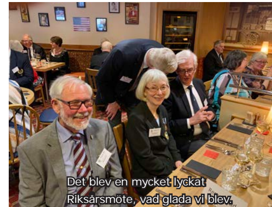
Det blev en mycket lyckat Riksårsmöte, vad glada vi blev,