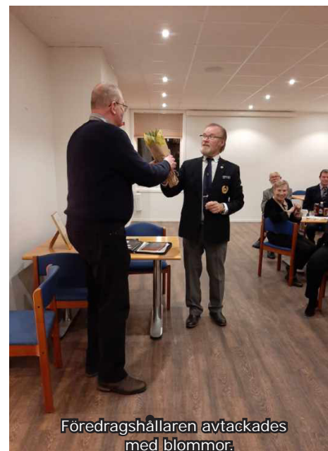
Föredragshållaren avtackades med blommor.

net. Det var ett tufft hantverk, som vid ett tillfälle ledde till att han fick en hjärtmuskelinflammation. Vid ett annat tillfälle ville två timmermän provdyka med hjälm - det gick tydligen inte så bra, men slutade med att man festade på Bullens pilsnerkorv istället.