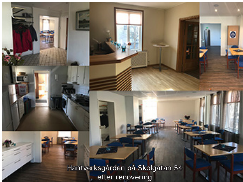
Hantverksgården på Skolgatan 54 efter renovering