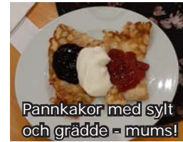
Pannkakor med sylt och grädde - mums!

Det hade blivit en dubbelbokning pga något missförstånd, så vi fick senarelägga janua- ris soppkväll en vecka. Detta hindrade inte de 30-talet medlemmar och inbjudna som deltog i soppkvällen från att få uppleva en rent magisk afton!