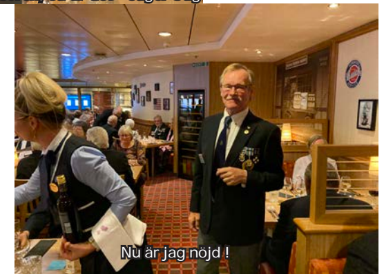
Nu är jag nöjd !

Alla konferenser, middagar och riksårsmötet genomfördes helt enligt programmet.