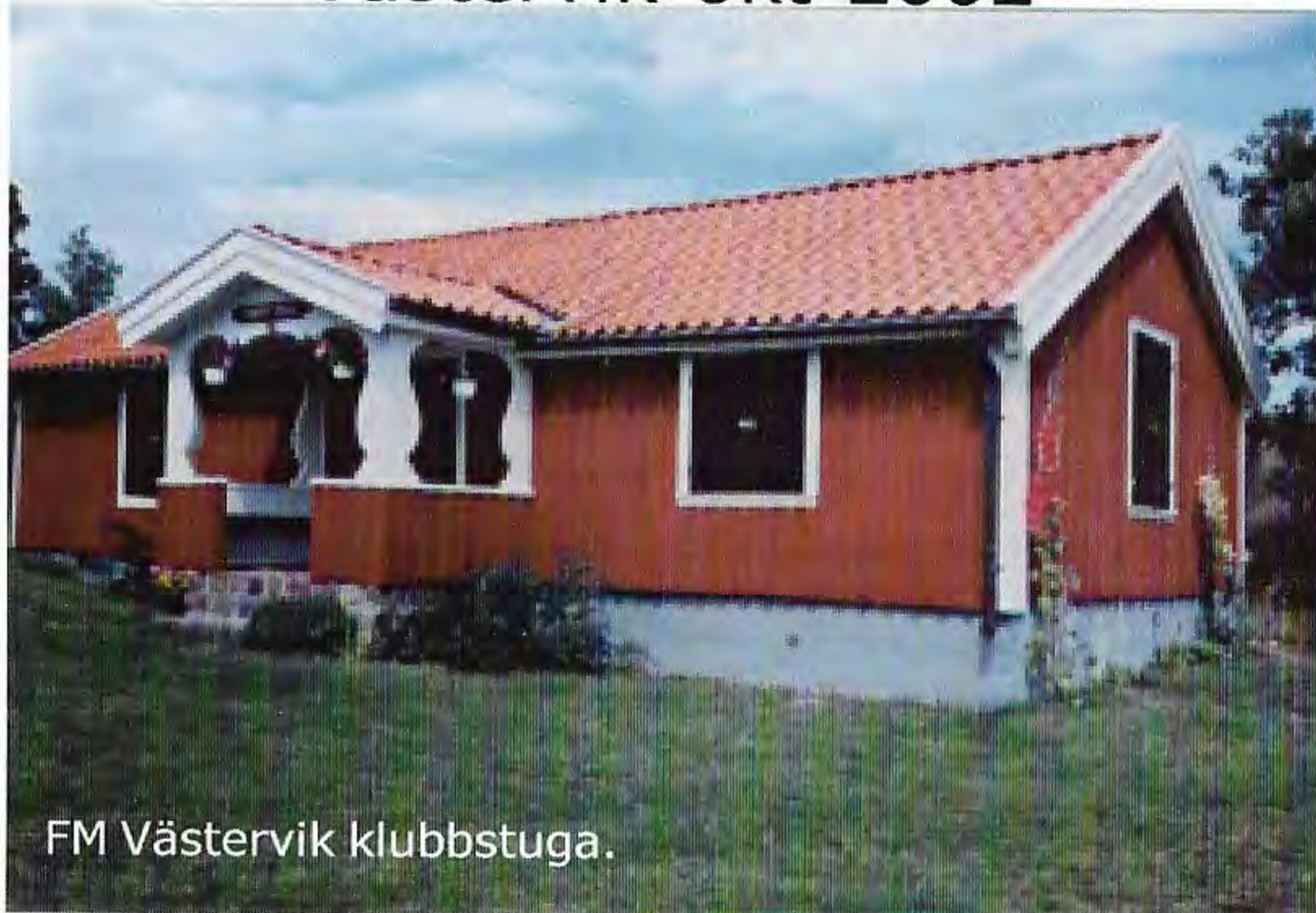
FM Västervik klubbstuga.

Ordföranden och vice ordföranden fick förtroendet att representera vår förening vid årets Lof-konferens som i år arrangerades av Västerviksföreningen. Föreningen hade hyrt övernattningsstugor vid Lysingsbadet och restauration och konferenser hölls på Krabbes krog och i Familjehotellet.