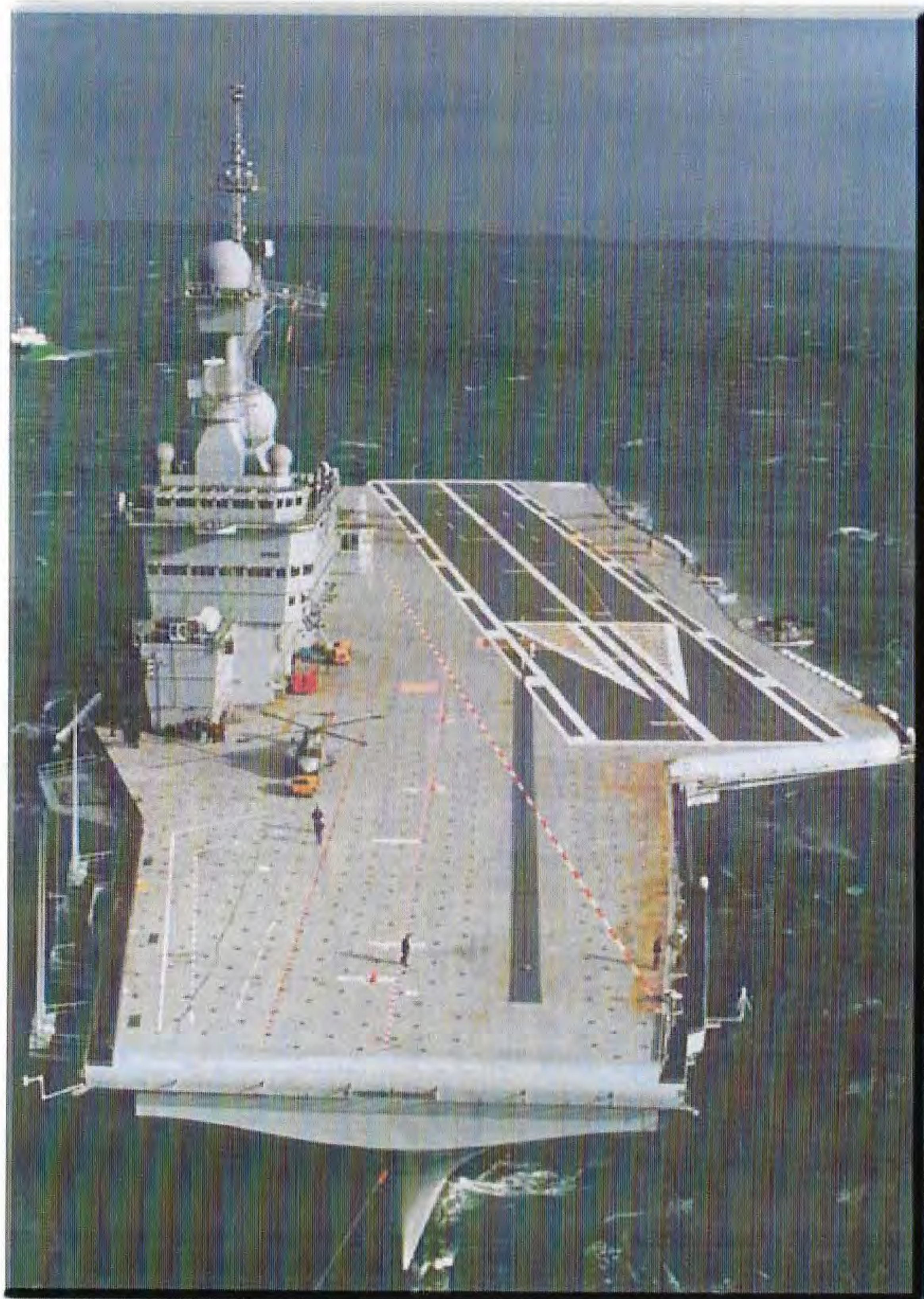
Frankrikes stolthet hangarfartyget Charles de Gaulle