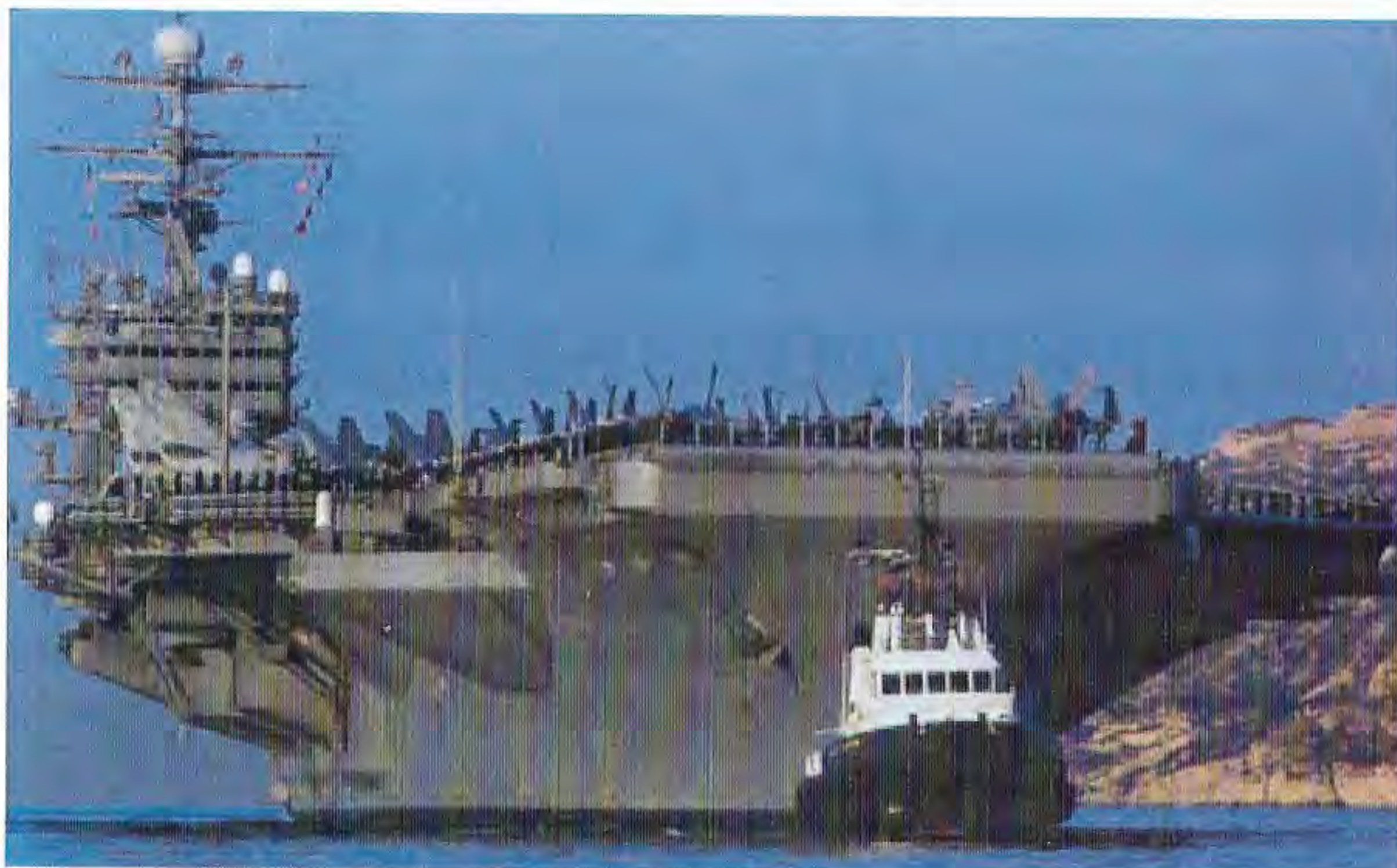
Hangarfartyget Charles de Gaulle har dragits med många barnsjukdomar innan det nu äntligen verkar färdigt för sin uppgift att bära trikoloren över världshaven.

amerikanska vapentyper än fransmännen. Storbritannien bistår tveklöst USA. Anglosaxarna talar samma språk, tänker i liknande banor, och har snarlika traditioner. Sådant gör det lätt att förstå varandra.