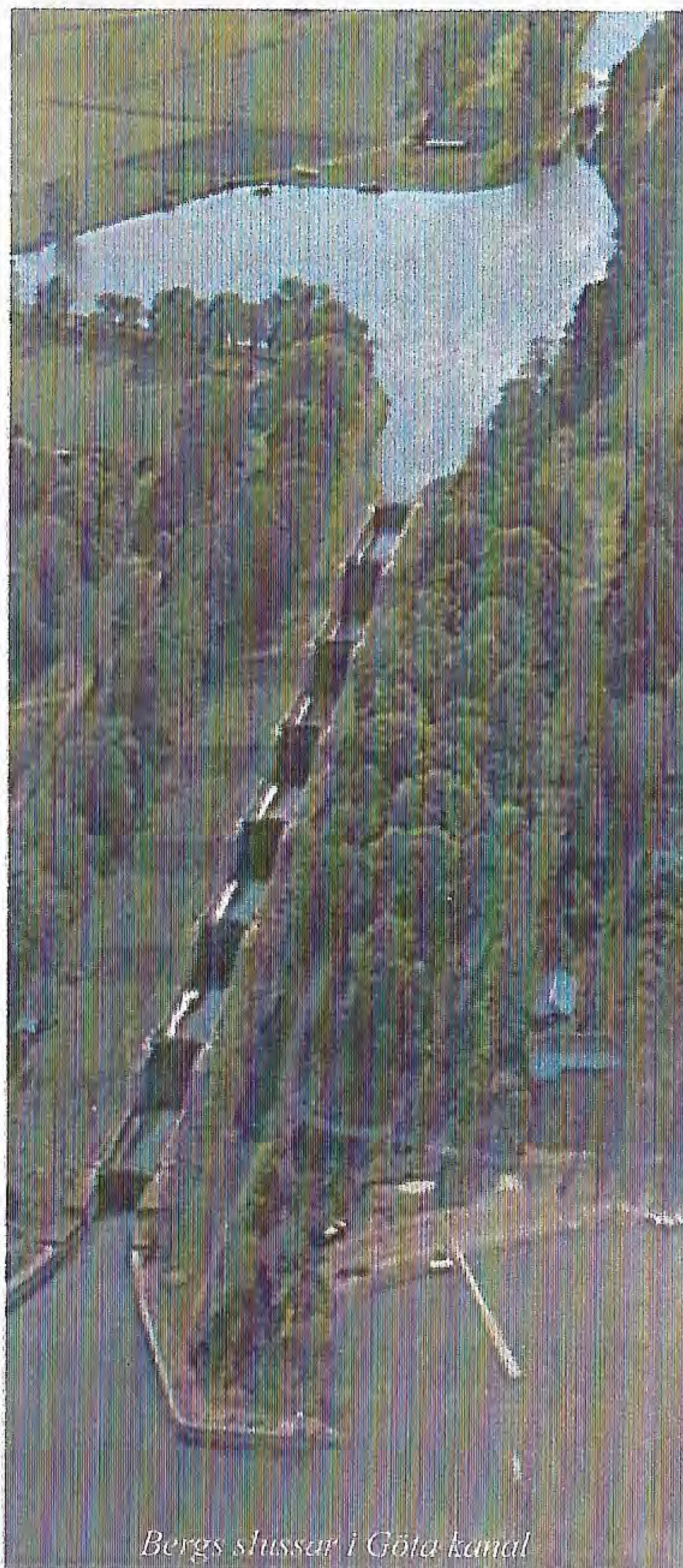
Bergs slussar i Göta kanal

Men spin-off-effekterna har i båda fallen varit betydande och jag vill genom utdrag ur Palanders bok Göta kanal och Hermans historia försöka peka på dessa fakta. Vid alla stora byggnationer uppstår kring arbetsplatserna betydande verksamhet som bieffekter av själva byggandet. Nya verkstäder uppstår med nya i många fall revolutionerande konstruktioner som än i dag används och är banbrytande inom byggteknik och verkstads-teknik. Tanken kring en kanal genom Sverige är gammal. Redan 1718 fick Christopher