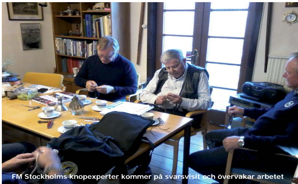
FM Stockholms knopexperter kommer på svarsvisit och övervakar arbetet