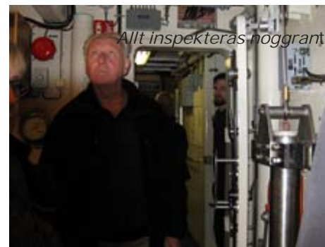
Allt inspekteras noggrant

tävla med den mänskliga förmågan. Fartygen har mycket goda manöveregenskaper och används dessutom för jakt på bottenavståndsmminor och arbetar i kustnära farvatten. De medför undervattensfarkoster typ Uven och är förberedd för framtidens undervattensfarkost, ROV S.