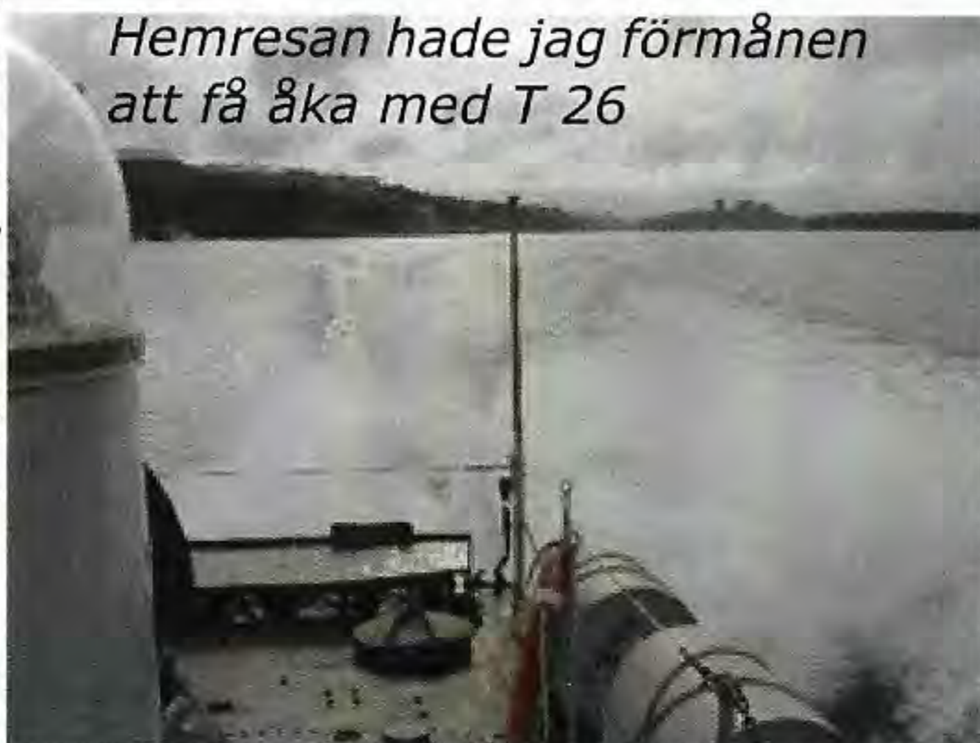
Hemresan hade jag förmånen att få åka med T 26

Jag fick en visning i maskin av Eron som med stort intresse förklarade för mig hur allt fungerar. Från bryggan finns direktmanöver enbart till hjälpmaskinerna. När det gäller manöver till huvudmaskineriet går det via ett signalsystem. Alltså måste maskin alltid vara bemannad med 2 maskinmän som håller i manöverspakarna för vardera huvudmaskin. Arbetsrutinen i maskin är att man i huvudsak byter vakt varje halvtimme.