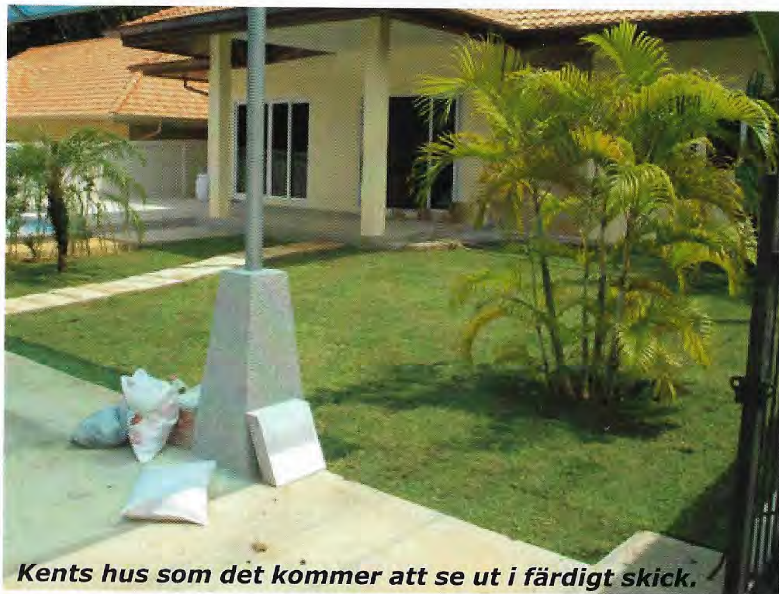
Kents hus som det kommer att se ut i färdigt skick.

och uppfattar min dåvarande bostad i Nynäshamn som onödigt stor och lyxig för en ungar.