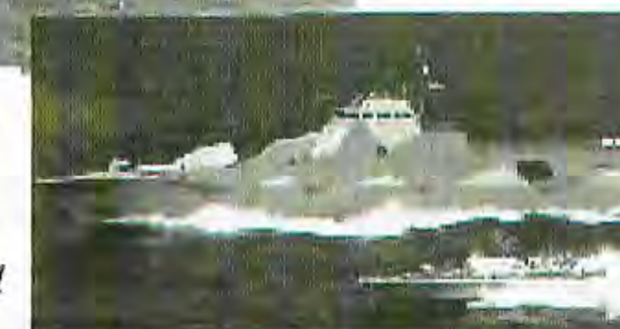
Biderna: Överst kryssren Fylgia i början av 20-talet. I mitten Tre Kronor ett resultat av upprustningen efter 1925 års försvarsbeslut, nämligen under VK 2. Tyvärr blev fartyget inte klart förrän kriget var slut. Det tar tid att rusta upp. Längst ner framtidens fartyg är redan här; korvetten Visby.

försvarsbeslutet. En minskning av det fast anställda befälet skedde efter 1925. Avsikten är att detsamma skall ske under genomförandet av kommande försvarsbeslut.