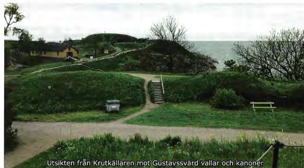
Utsikten från Krutkällaren mot Gustavssvärd vallar och kanoner

På den tid vi hade till buds var det omöjligt att hinna med att besöka hela anläggningen, som breder ut sig på fyra öar. Guiden ledde oss därför över bron mellan Stora Öster Svartö och till Vargön. Där vi bl a kom till borggården där kvarlevorna efter Augustin Ehrensvärd fått sin sista vila, och där slutligen fått komma till ro efter att under tidigare år flyttats runt på ett par ställen. I en av byggnaderna är ett Ehrensvärd museum inrett, där man kan få en inblick i hur högreståndspersoner bodde.