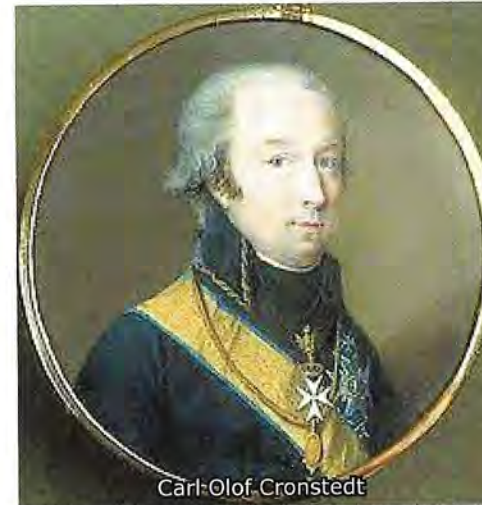
Carl Olof Cronstedt

När 1808-09 års krig inleddes var Carl Olof Cronstedt kommandant på Sveaborg. Ryska trupper intog Helsingfors över isen den 2 mars 1808. Det var dock osannolikt att den första ryska styrkan ensam skulle kunna inta Sveaborg så länge det fanns krut i fästningen, där 7000 man och hela svenska skärgårdsflottan med över 200 fartyg var placerade. Cronstedt besköt de ryska trupperna i Helsingfors så kraftigt att den kvarvarande