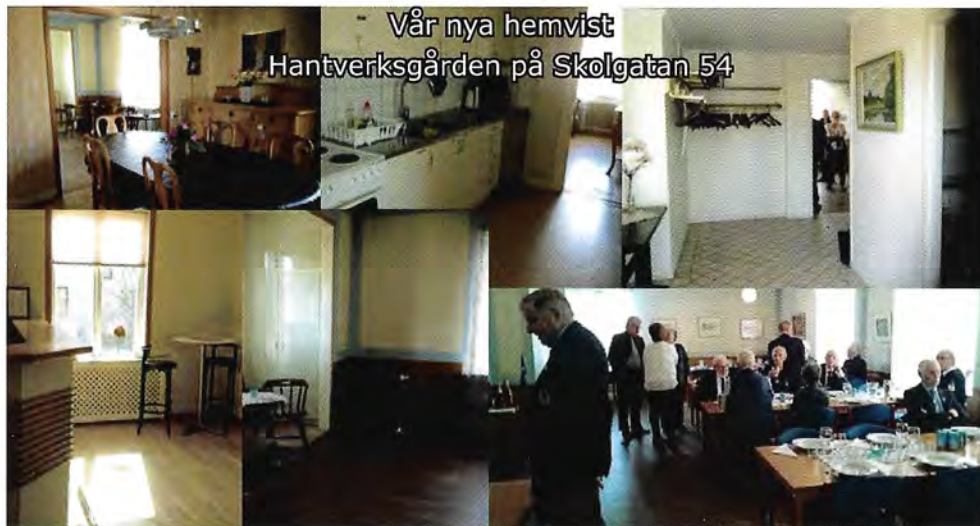
Vår nya hemvist Hantverksgården på Skolgatan 54

Karlssons köttbod & Catering Fredagatan 10 149 30 Nynäshamn Telefon 08-500 494 10 info@karlssonskottbod.se