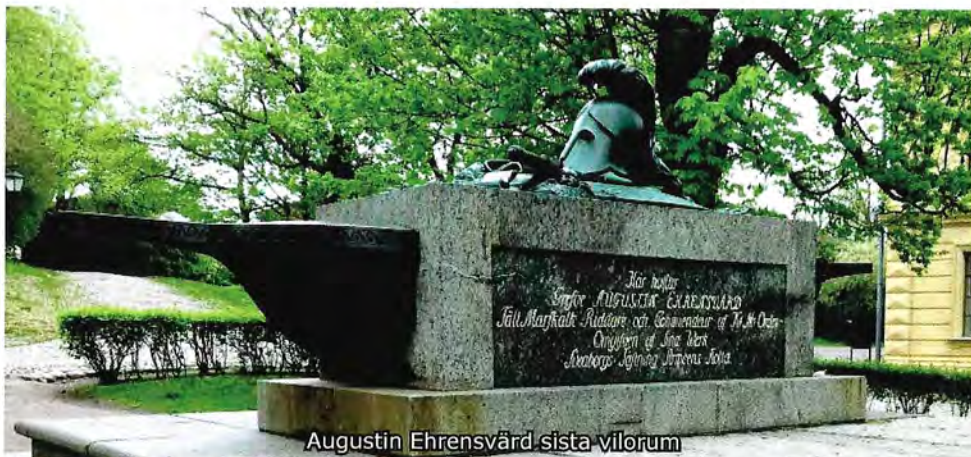
Augustin Ehrensvärd sista vilorum

Efter att ha blivit fullmatade med fästningens historia delades vi upp i grupper och började rundvandringen.