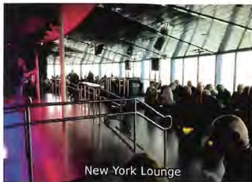
New York Lounge

Efter en dryg timmas underhållning tog vi oss ner till däck 6 där kvällens förbrödringsmiddag skulle serveras. Några av oss lyckades komma ganska långt fram i kön och kunde därför med raska steg ta ut kursen mot den för riksmötesdeltagarna reserverade platsen längst akter ut i den stora matsalen, och där hitta en hörna där vi (efter komplettering med några stolar) fick möjlighet att sitta tillsammans. Det var så vist ordnat att man där hade dukat fram samma kalla och varma rätter som kunde återfinnas i den främre delen av matsalen.