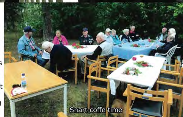
Snart coffe time

Det var nu dags att tillkännage resultaten av de kunskaper som presterats under tipsrundan. Det var ingen vanlig 1 x 2 runda. Här skulle man i stället pricka in rätt bokstav av tre alternativ som i slutändan skulle bilda de tre ord som är allemansrättens huvudregel.