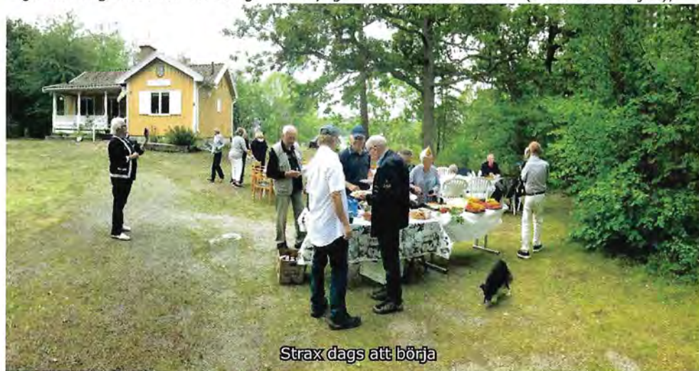
Strax dags att börja

I slutändan visade det sig att vi blev tjugoen deltagare på årets höst-kräftfest. Det som glädde mig mest var att vår ganska nyligen näst äldste medlem (90-år den 27 juli),