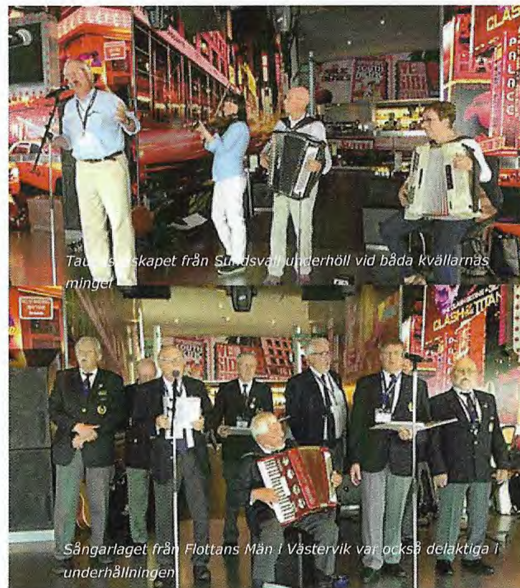
Talvis skapet från Sundsvall underhöll vid båda kvällarnas mingel