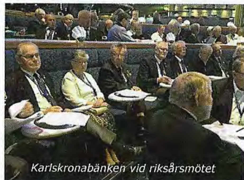
Karlskronabänken vid riksårs mötet