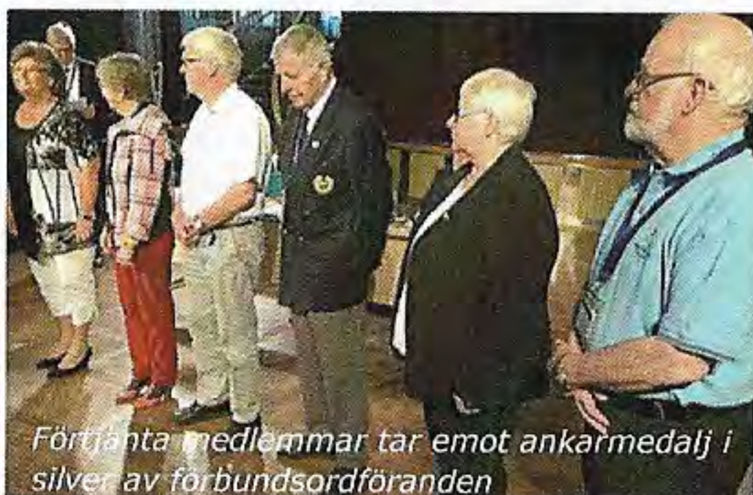
Förtjänta medlemmar tar emot ankarmedalj i silver av förbundsordföranden

redning med mest omval och ett fåtal nyval och vi fick veta lite om vad som ska ske 2016 där vårt främsta uppdrag är att satsa på medlemsvård. Nya utgåvan av Flagg och Heders kommer att