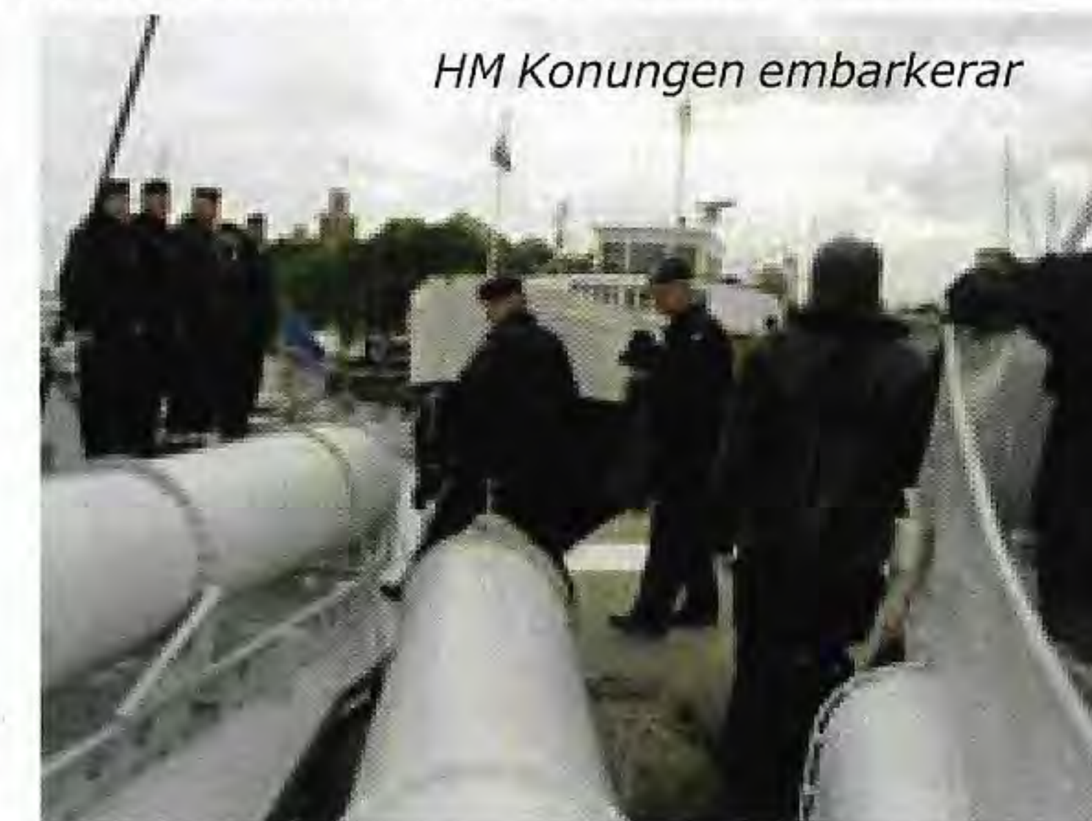
HM Konungen embarkerar

tog tid. Skämtsamt sa man att Kungen skall nog åka med. Nåja folk stod på kajen och väntade tålmodigt på att vi skulle kasta loss. Besättningen på T46, som låg på utsidan av vår båt, var snyggt och prydligt uppställda såsom om CKF skulle komma ombord. Ingen rök utan eld. Tre svarta Mercedes kom med hög fart och stannade framför båtarna och ut kommer Kungen och embarkerar T46. Upp med den kungliga fanan och därefter går han runt och hälsar på besättningen och medföljande gäster.