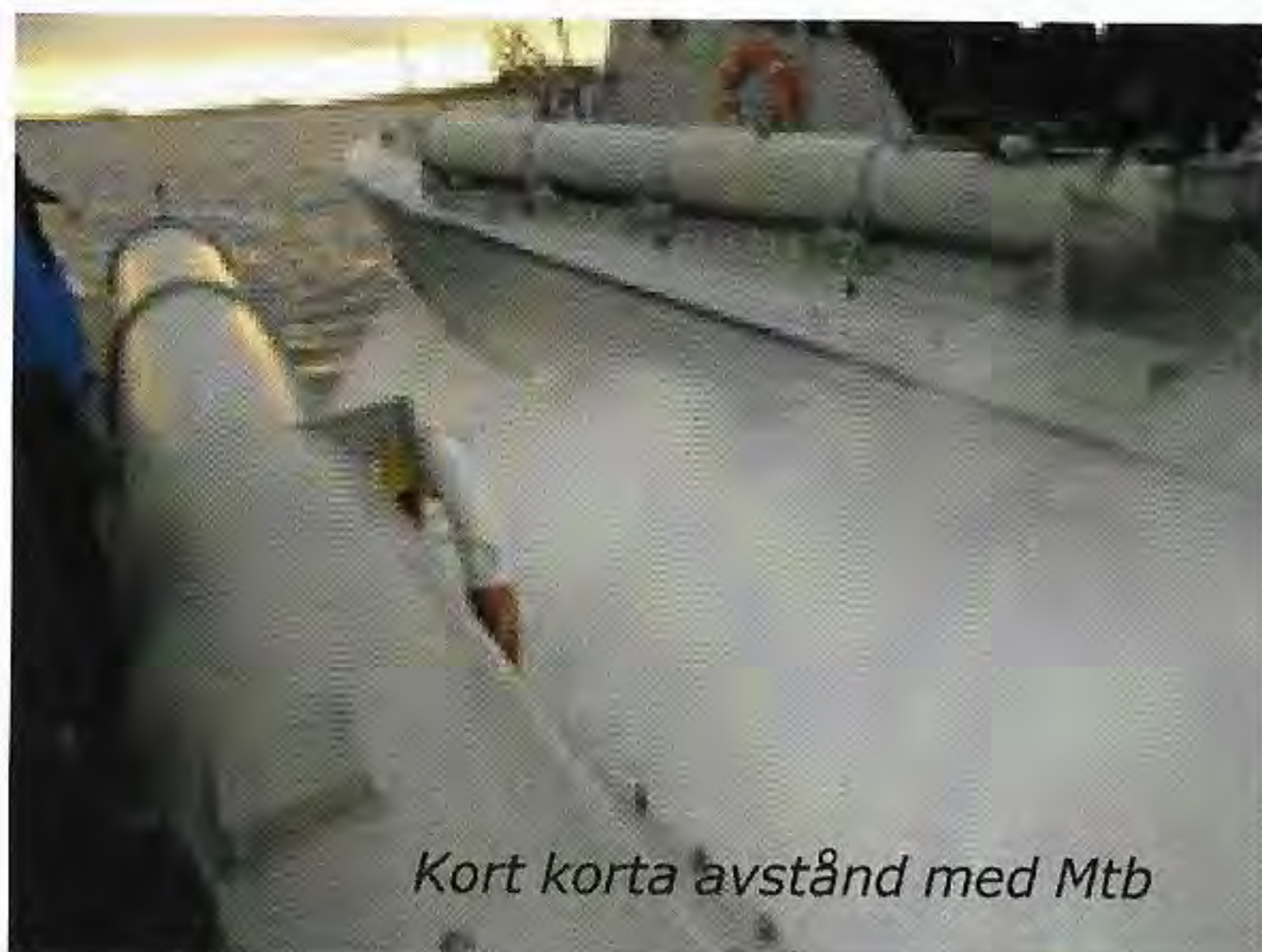
Kort korta avstånd med Mtb