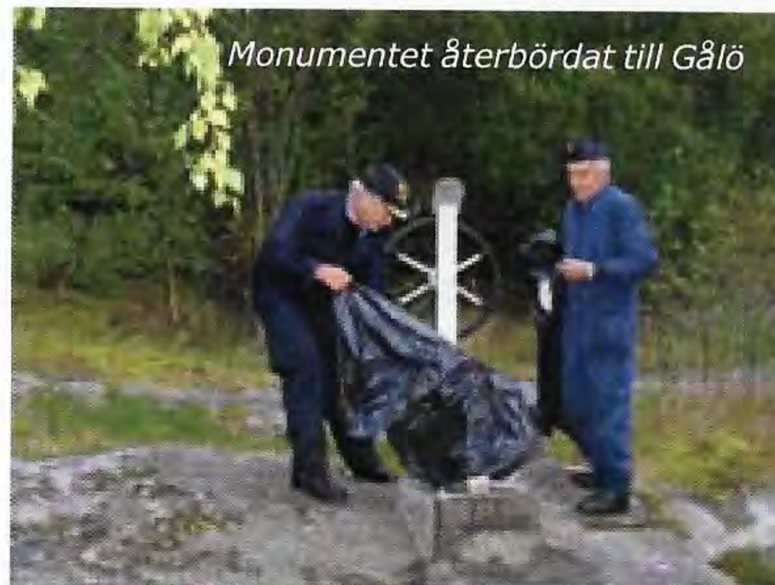
Monumentet återbördat till Gålö