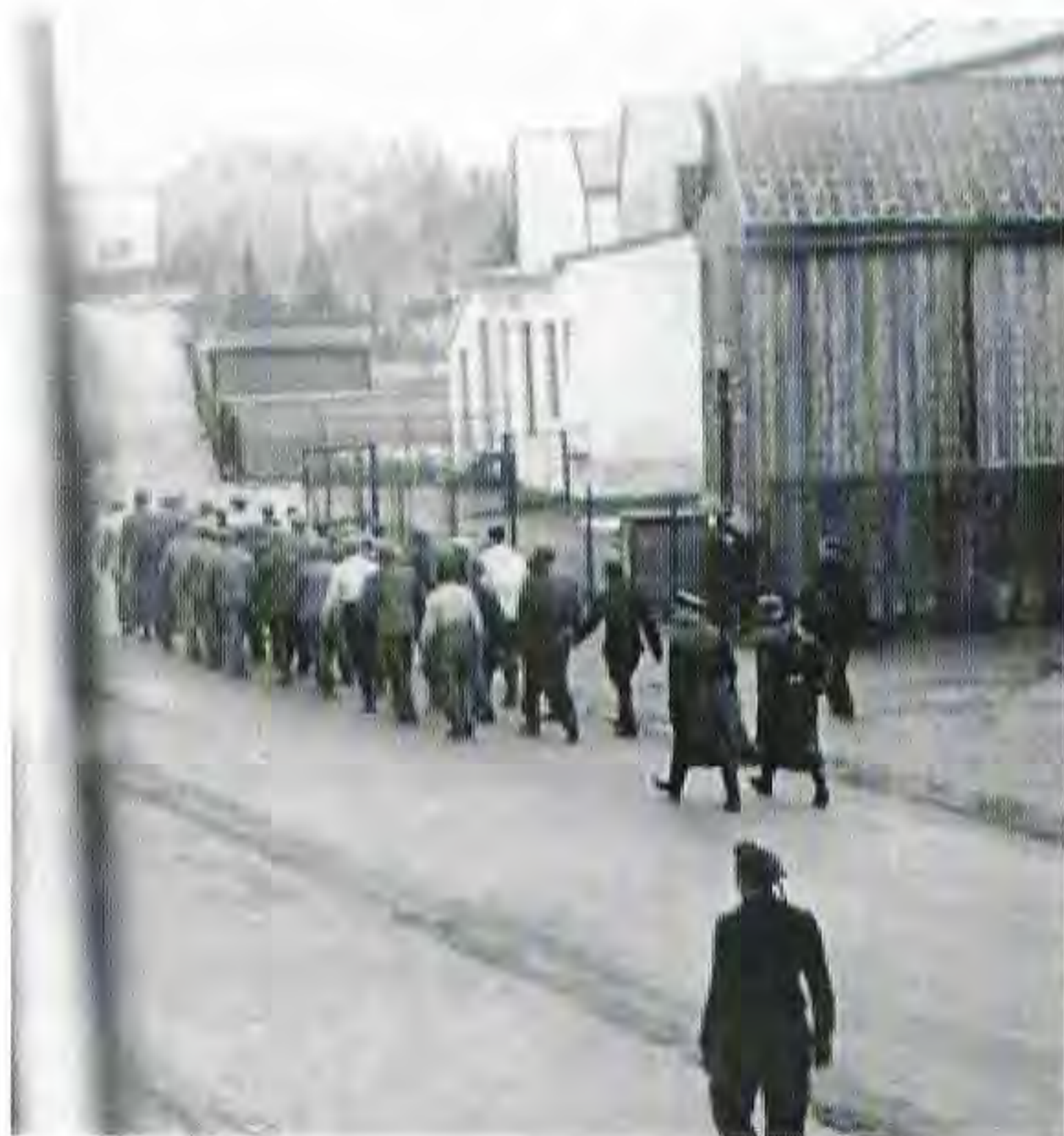
Dagligen växer de norska fånglägren där motståndare till Quislingregimen inspärras. Ovan en rad fångar som från Trondheim förs till ett koncentrationsläger.

När finska vinterkriget mot Sovjet slutat i mars 1940 och de 8 000 svenska frivilliga inklusive ett antal danskar och norrmän höll på att demobilisera och fara hem, blixtockuperade tyskarna Danmark och Norge under natten till den 9 april. Danmark sträckte omedelbart vapen, men norrmännen satte sig till motvärn. Många av de hemvändande ville nu fortsätta direkt till Norge. Men Sverige hade förklarat sig neutralt i kriget mellan Tyskland och västmakterna. I det finska fallet sade man sig vara "icke krigförande" och kunde därmed låta frivilliga ur armén och flygvapnet att ge sig dit. I