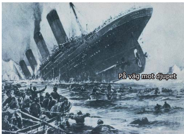
På väg mot djupet

Evakueringen av Titanic utvecklades efter hand till en av 1900-talets mardrömmar. Att livbåtar saknades för över 1 000 personer var ett okänt faktum, och det första båtarna visade sig svåra att fylla. Många skickades iväg halvfyllda, och inte ens det. Titanic tedde sig säkrare än en bräcklig liten livbåt, och ett rykte spreds att man inom kort skulle vara omringad av fartyg som skyndade till undsättning från alla håll. I takt med den