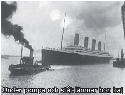
Under pompa och ståt lämnar hon kaj

Titanic lämnade Southampton den 10 april 1912 med destination New York. De flesta av de hundratals skandinaverna, och hela besättningen om 890 man fanns då ombord. Jungfruresan hann inte pågå mer än 5 minuter innan en incident inträffade som om den bara varit lite större antagligen skulle ha räddat Titanic; förtöjningarna till ett annat fartyg slet sig på grund av suget från Titanics propellrar och en regelrätt kollision undveks med bara några decimeters marginal. Kraftigt försenad gick Titanic sedan rakt över engelska kanalen till Cherbourg, och därifrån till Queenstown i Irland,