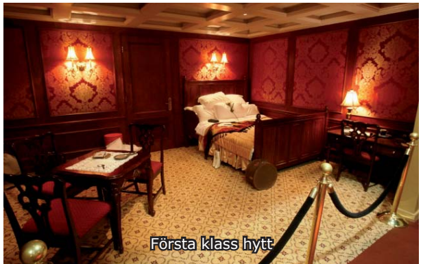
Första klass hytt

Särskilt i första klass var inredningen överdådig, och mycket ombord var "sista skriket". Det fanns ett gym, en swimmingpool, en hundkennel, hissar, telefoner och ett mörkrum där man kunde framkalla sina fotografier. Fartyget stod i radioförbindelse med omvärlden och en tidning – Atlantic Daily Bulletin – trycktes varje dag och innehöll bl a de senaste aktiekurserna.