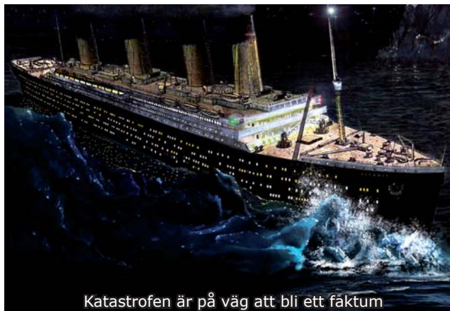
Katastrofen är på väg att bli ett faktum

Söndag kväll den 14 april befann sig Titanic på västra nordatlanten, i ett område där