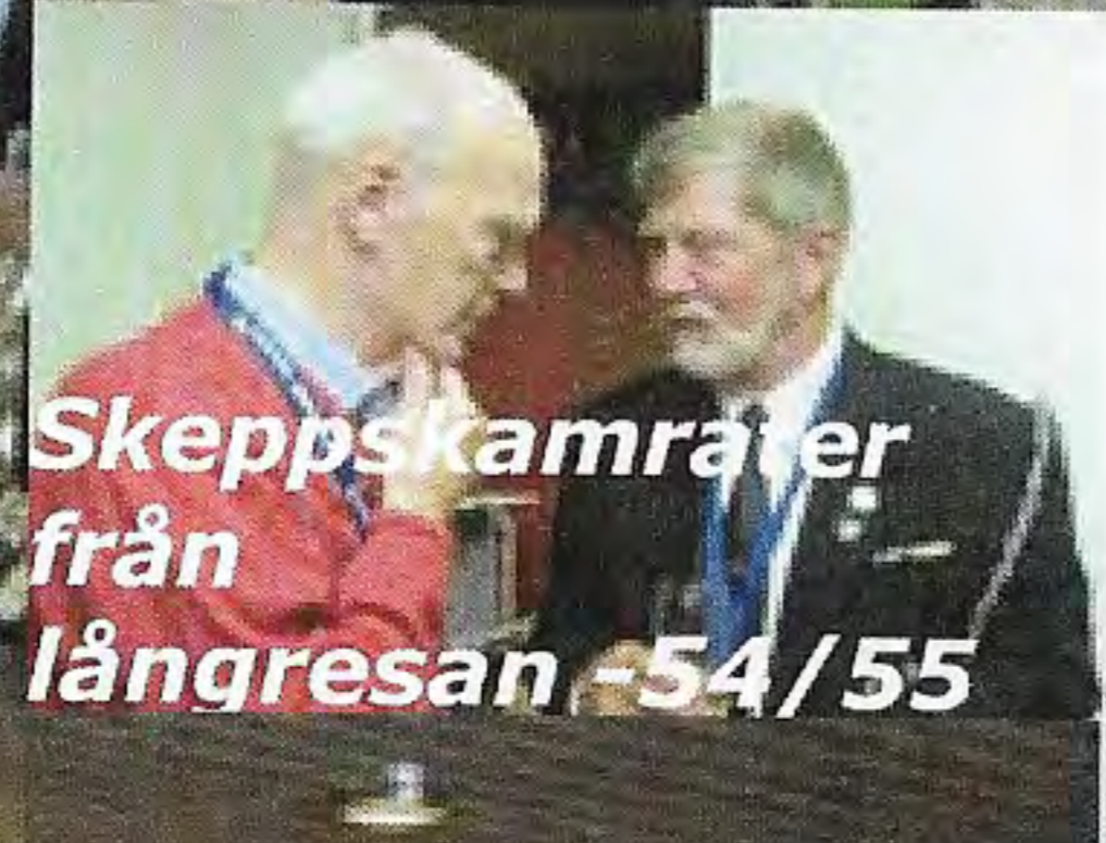
Skeppskamrater från långresan -54/55