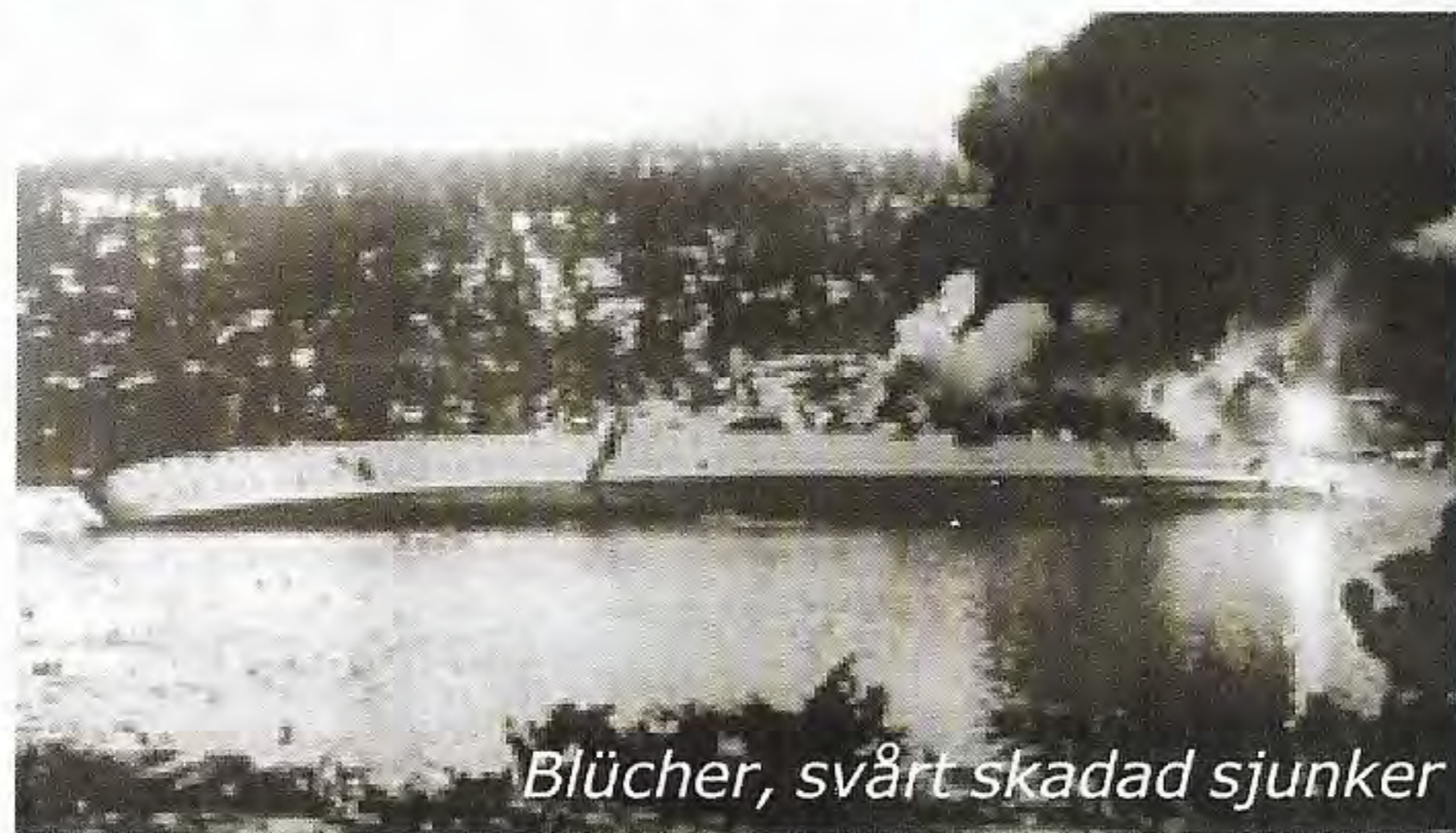
Blücher, svårt skadad sjunker

blev de norska pansarskeppen KNM Norge och KNM Eidsvold torpederade i Narviks hamn. Den 10 april slog den brittiska 2. Jagarflottiljen till, de tyska patrullbåtarna hade av oklar anledning lämnat sina patrullzoner