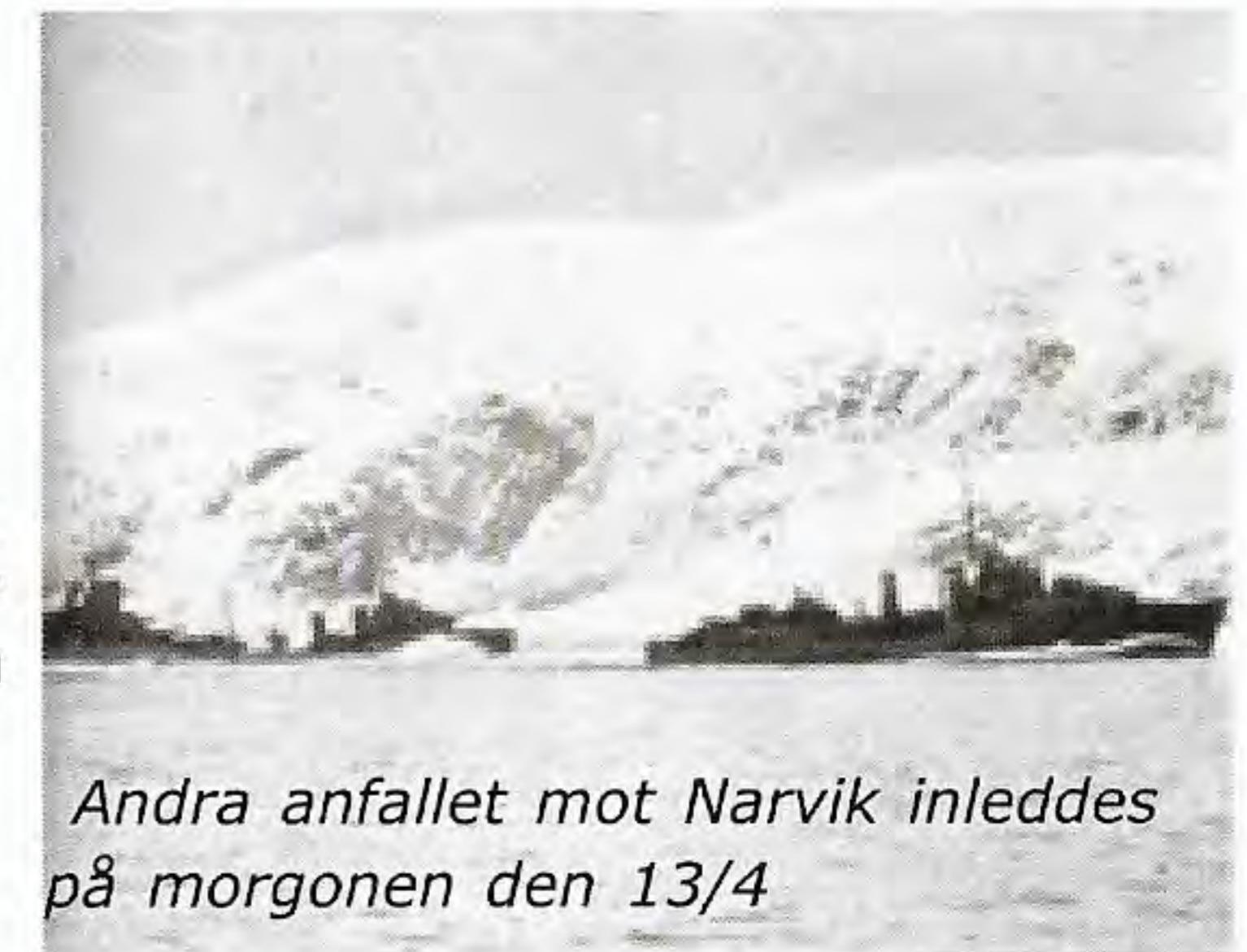
Andra anfallet mot Narvik inleddes på morgonen den 13/4

därefter exploderade det i akte ammunitionsmagasinet på jagaren Schmidt. Roeder stod snart i ljusan låga och den ineffektiva svarselden från Künne och Lüdemann hade snart tystnat på grund av skador. Britterna sänkte dessutom två tyska malmfartyg. De brittiska jagarna, Hardy, Hotspur, Hunter,