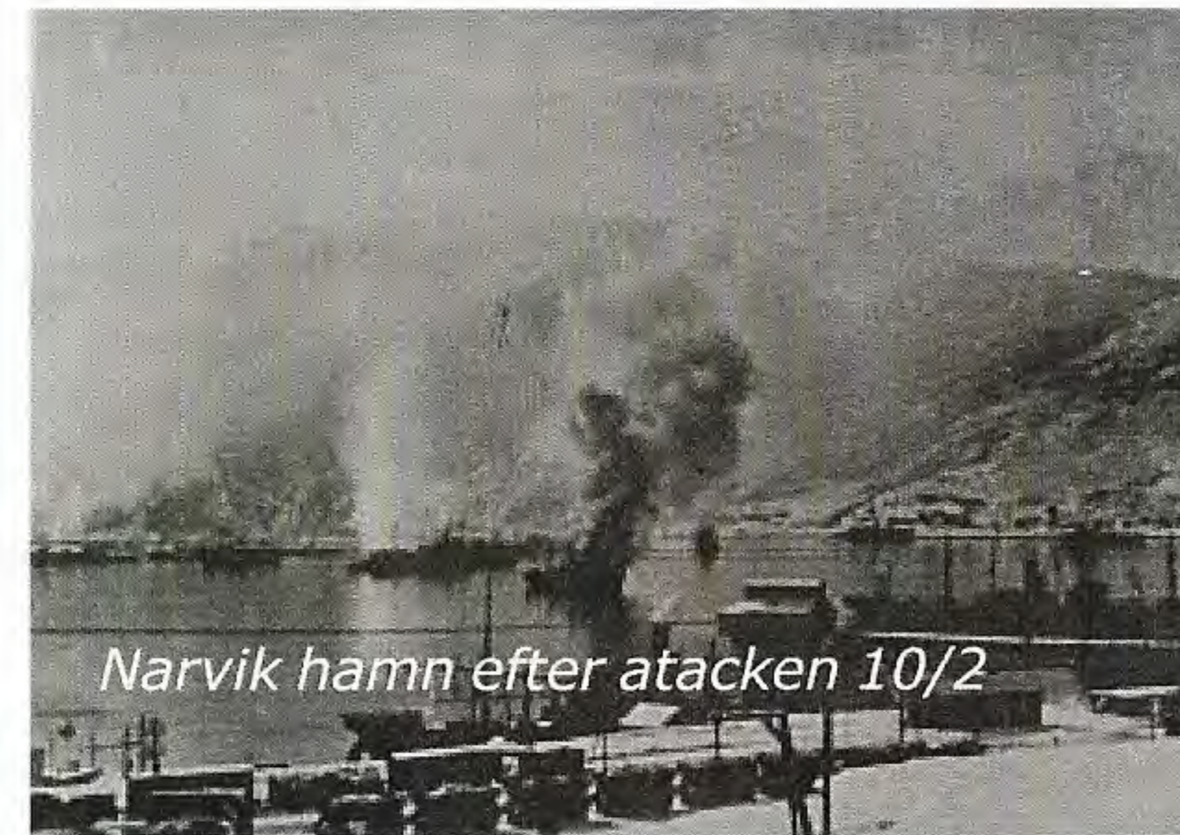
Narvik hamn efter attacken 10/2

Först träffades den tyska jagaren Heidenkamp av torpeder och