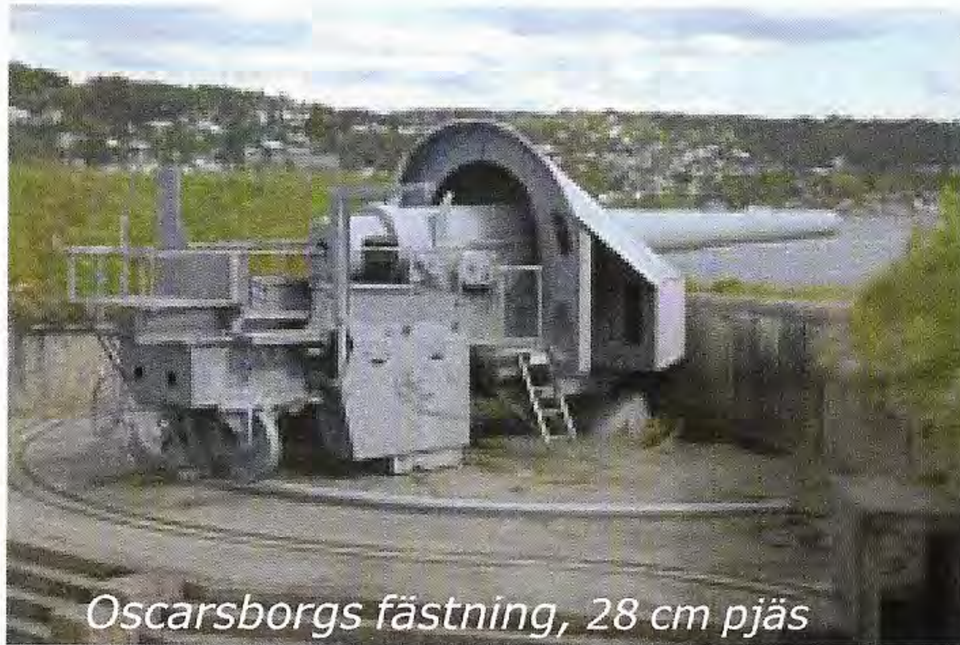
Oscarsborgs fästning, 28 cm pjäs

Sänkningen av Blücher fördröjde de tyska invasionstruppernas intåg i Oslo så pass länge att det norska kungahuset, regeringen och försvarsledningen hann fly huvudstaden och gavs utrymme att organisera landets väpnade motstånd.