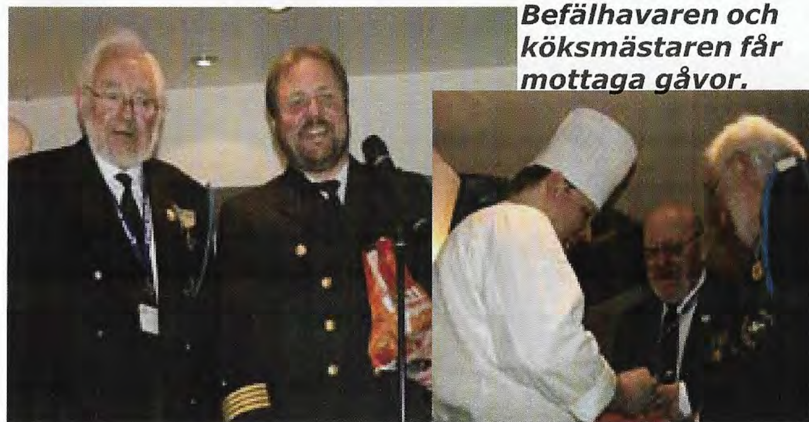
Befälhavaren och köksmästaren får mottaga gåvor.