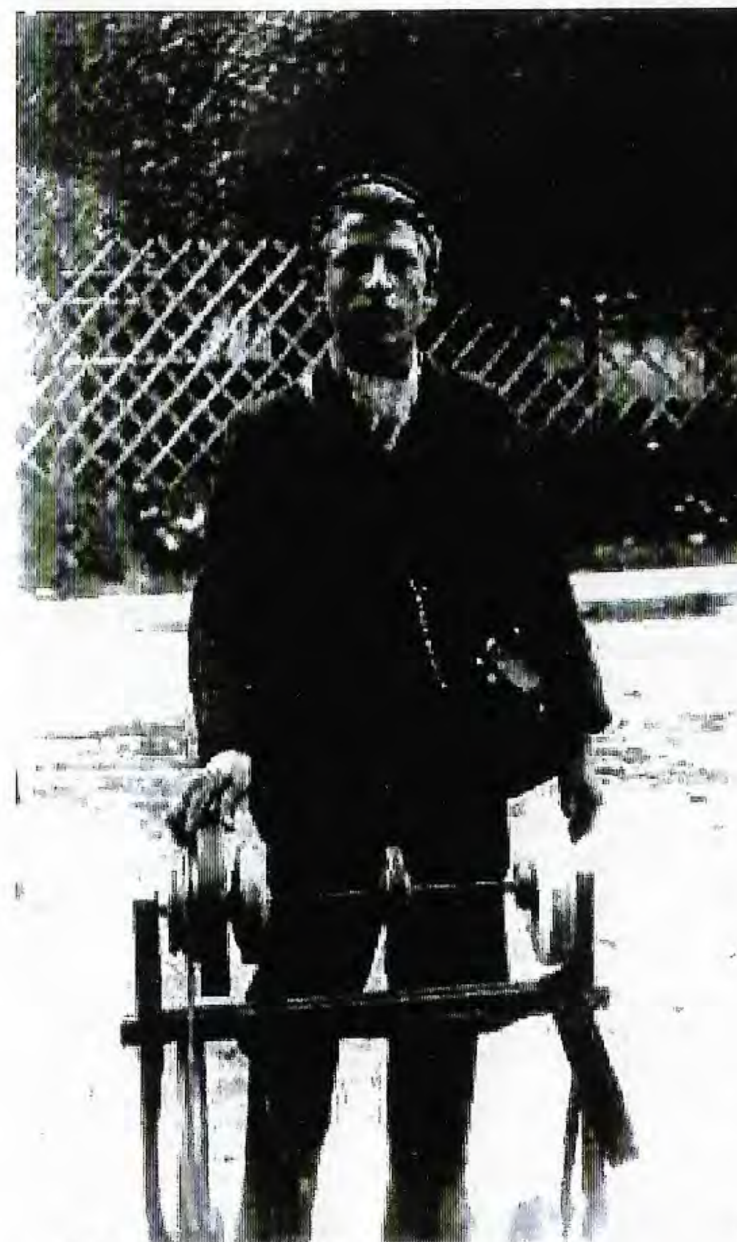
"Rykten förekom att sågfilarna i själva verket var spioner"

Det kom snart rykten i omlopp om att sågfilarna i själva verket var förklädda officerare från "arvfienden" Ryssland som rekognoserade