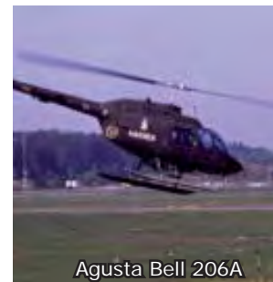
Agusta Bell 206A

1970-71 levererades 10 st. Agusta Bell 206A. Vår benämning HKP 6. Kunde ta sjb. 11.