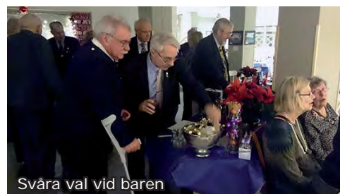
Svåra val vid baren

När det sedan inte var tomt på alla faten, men gästerna hade tagit