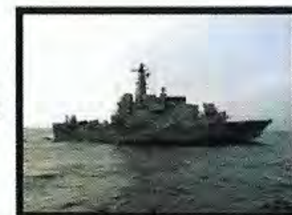
Minröjningsfartyg av Kosterklass - HMS Koster - HMS Ven - HMS Kullen