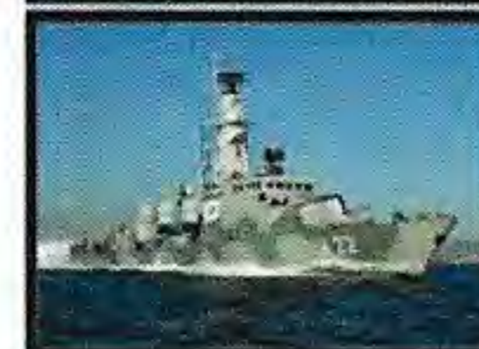
Korvetter av Göteborgsklass (- HMS Gävle) - HMS Sundsvall