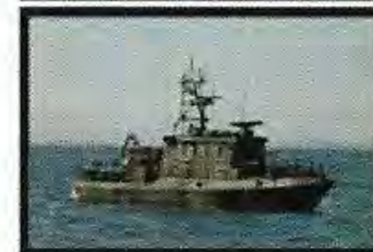
Bevakningsbåt typ 80 - HMS Munter - HMS Orädd