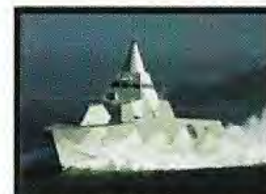
Korvetter av Visbyklass - HMS Visby (m Hkp15-kap) - HMS Helsingborg