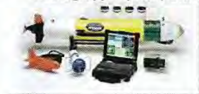
1 EOD grupp (ASU)