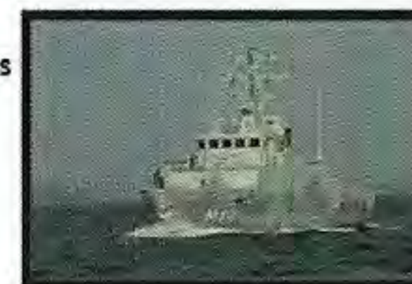
Röjdykarfartyg - HMS Spårö

hon gör så gott hon kan och lär sig mycket.