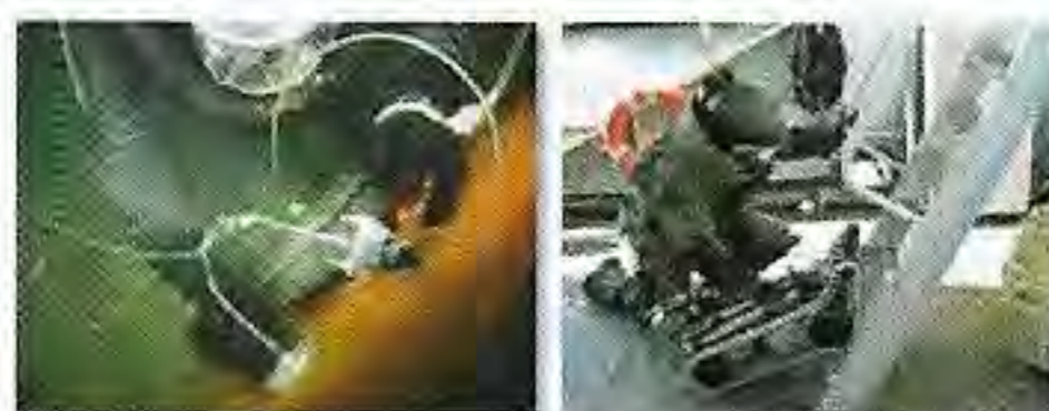
4 EOD grupper (CMD, UMD, IEDD)