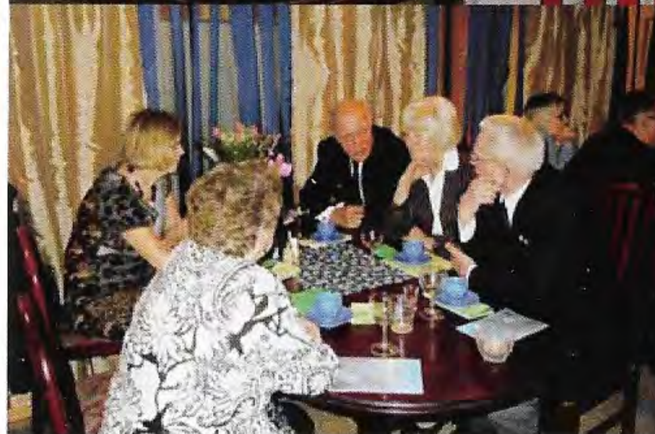
Bilder från årsmötesfest

Omkring 2130 började middagsgästerna att röra sig mot hemmets lugna vrå efter en i alla avseenden trevlig årsfest.