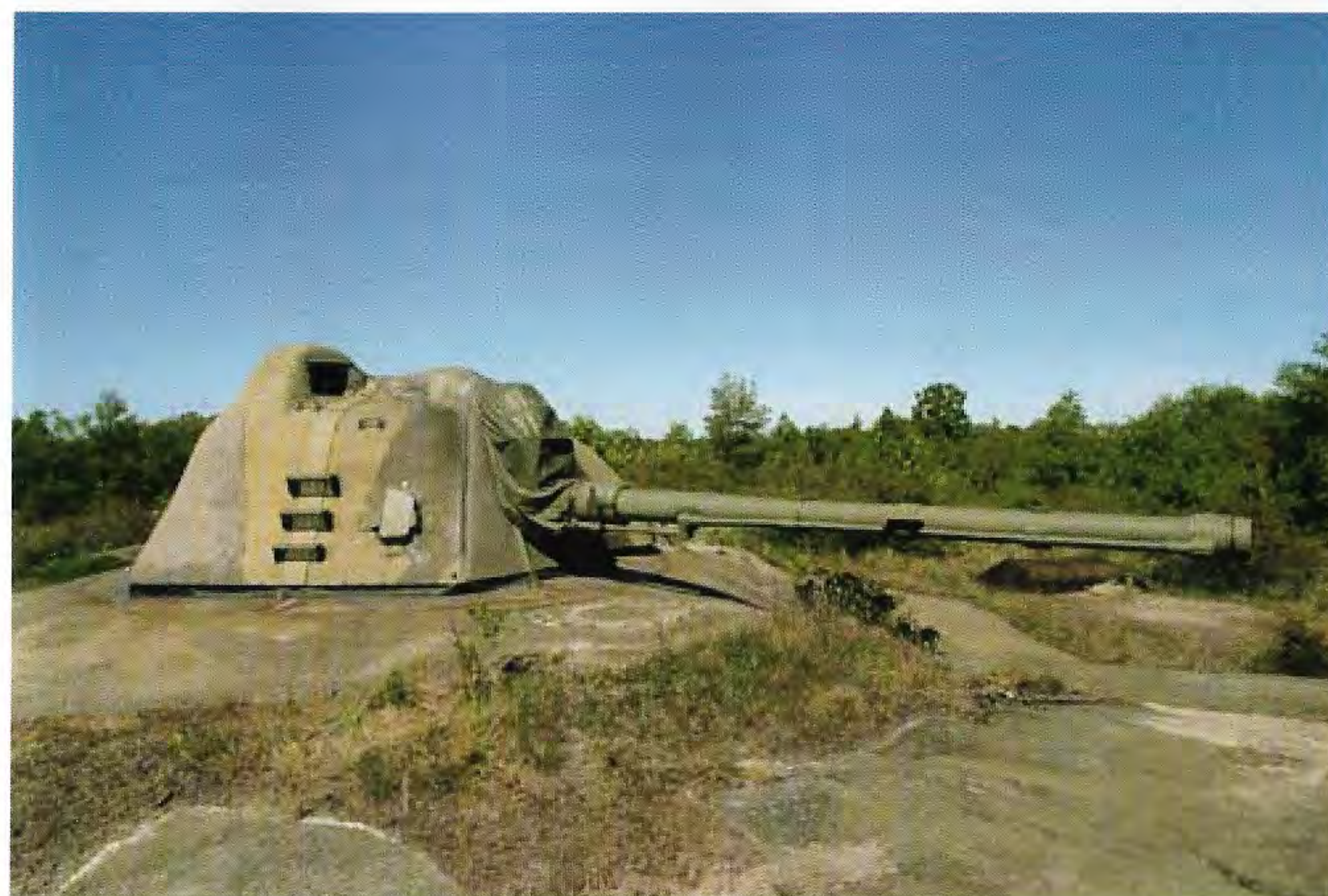
Ersta 12/70, 'världens bästa KA-pjäs'

Intresserade rekommenderas varmt boken nedan, som behandlar KA-utvecklingen t o m Ersta-epoken.