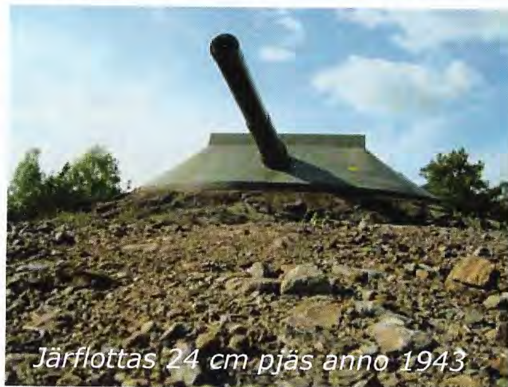
Järflottas 24 cm pjäs anno 1943

Verkansområde bassängen Järflotta-Gunnarstenarna-Nåttarö. Batteri LO kom att avge verkanseld mot 'objudna gäster' vid flera tillfällen under neutralitesvakten. En museikanon är bevarad interiört och två exteriört (se bild).