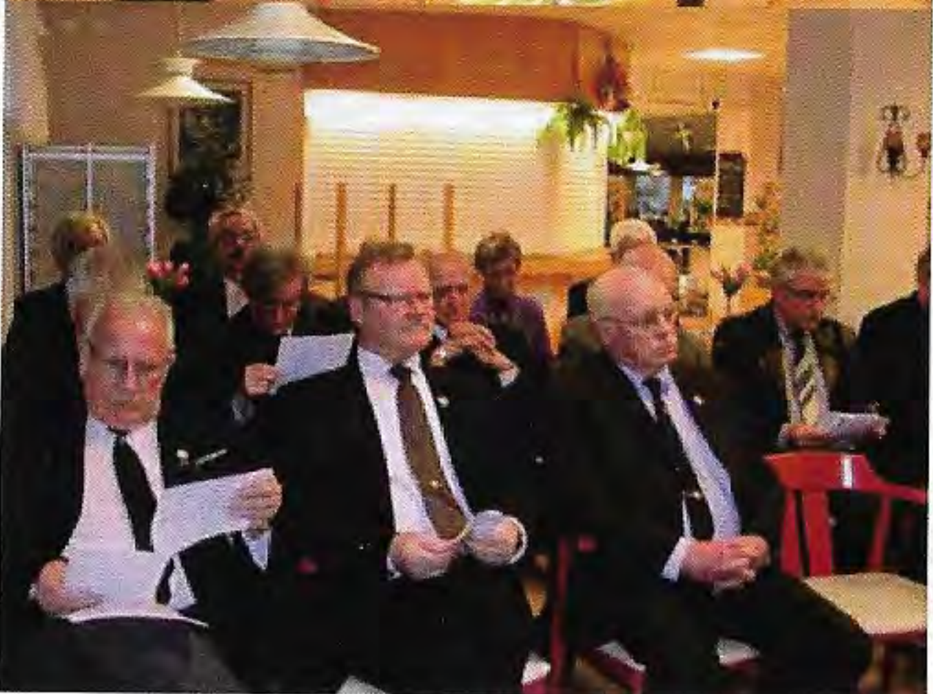
Bilder från årsmötesförhandlingarna