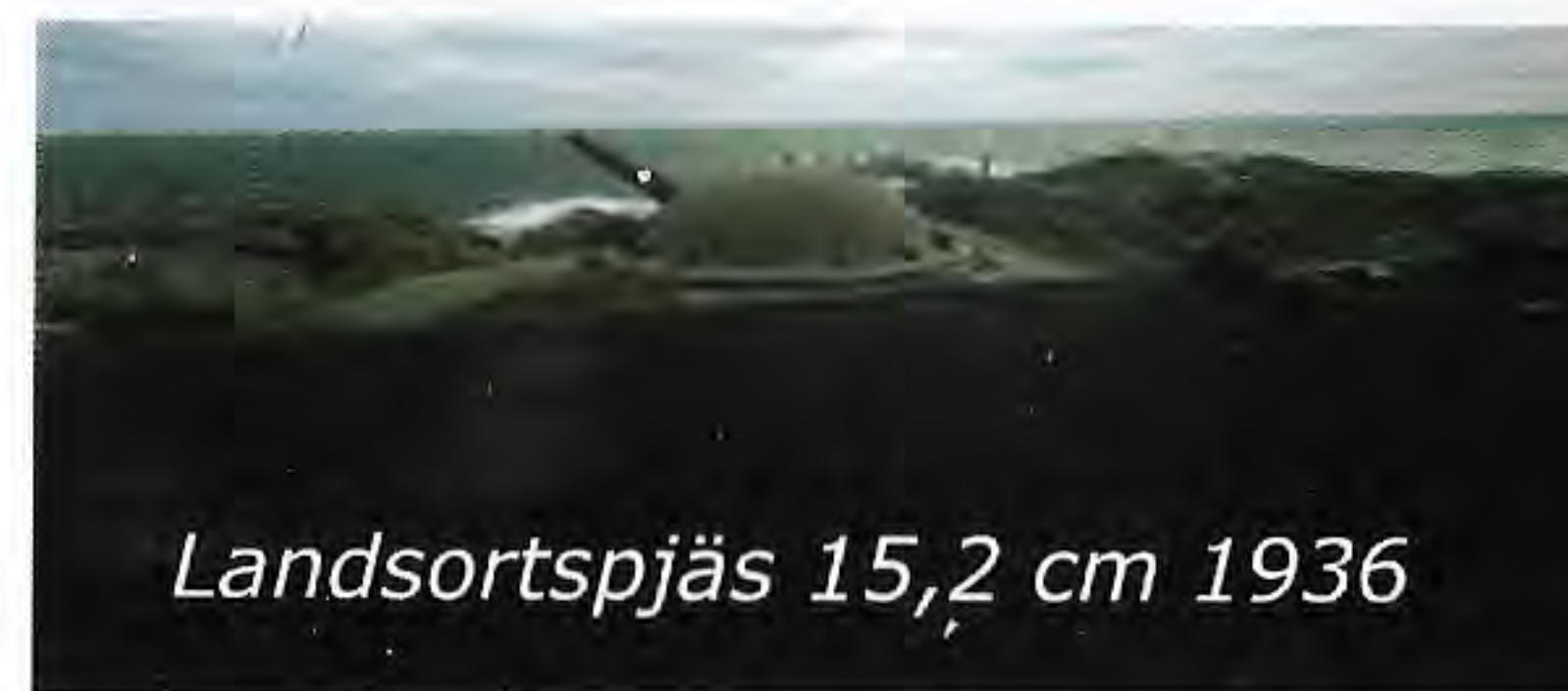
Landsortspjäs 15,2 cm 1936