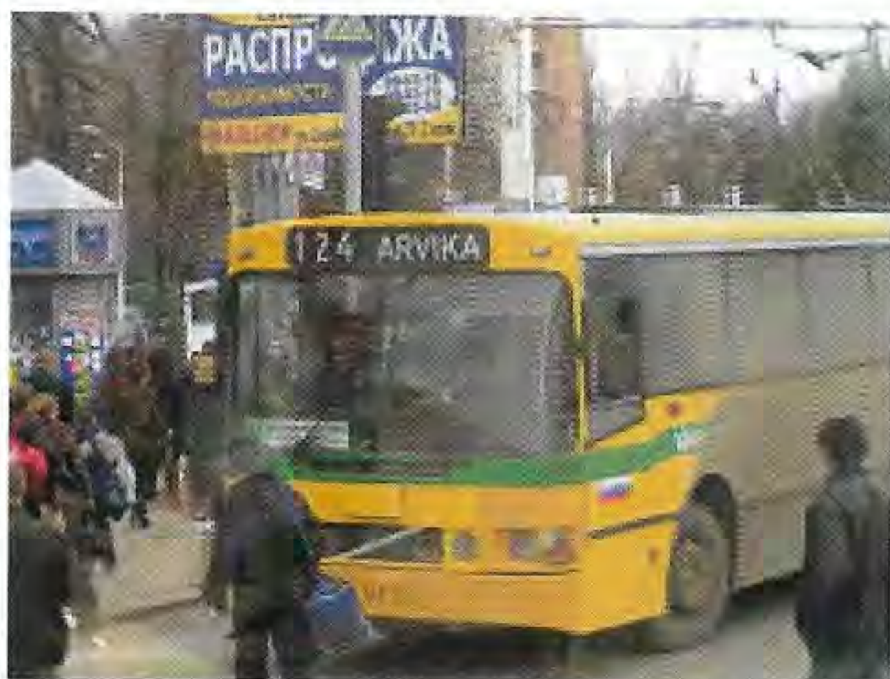
Svenska bussar i Volgograd

Tillbaka i Kiev avslutar vi med föreställning på den prunkande vackra Kievoperan, som ofta i stater som dessa är viktiga nationalsymboler. Därinne står tiden liksom stilla .. utanför på stan vajar orangea och andra politiska partiers flaggor inför parlamentsvalet och det unga landets något turbulenta anpassning till demokrati.