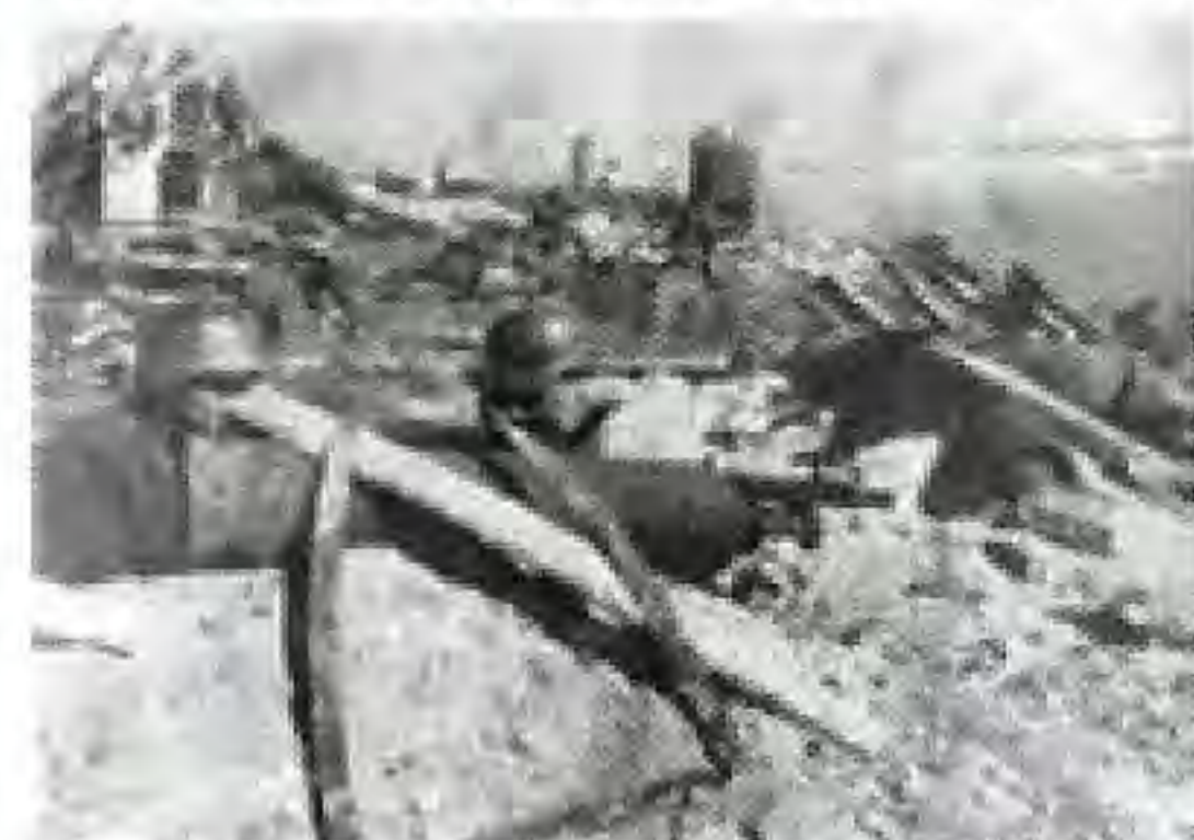
I striderna som pågick under 200 dagar deltog över 2 miljoner man från båda sidor, 2000 stridsvagnar, 26 000 kanoner och 2000 flygplan

Ni minns historieboken ... Tyskland anfaller 1 sept 1939 Polen i tron att västmakterna än en gång förblir passiva, men krigsförklaring följer. I botten finns Hitler (Ribbentrop)-Stalin (Molotov) pakten om Polens delning mellan dem och Stalins fria händer i Baltikum. Parallellt finns även en Stalin-Churchill pakt. Hitler söker 'lebensraum' österut mot Volga och tror sig genom detta också kunna 'slå England i öster'.