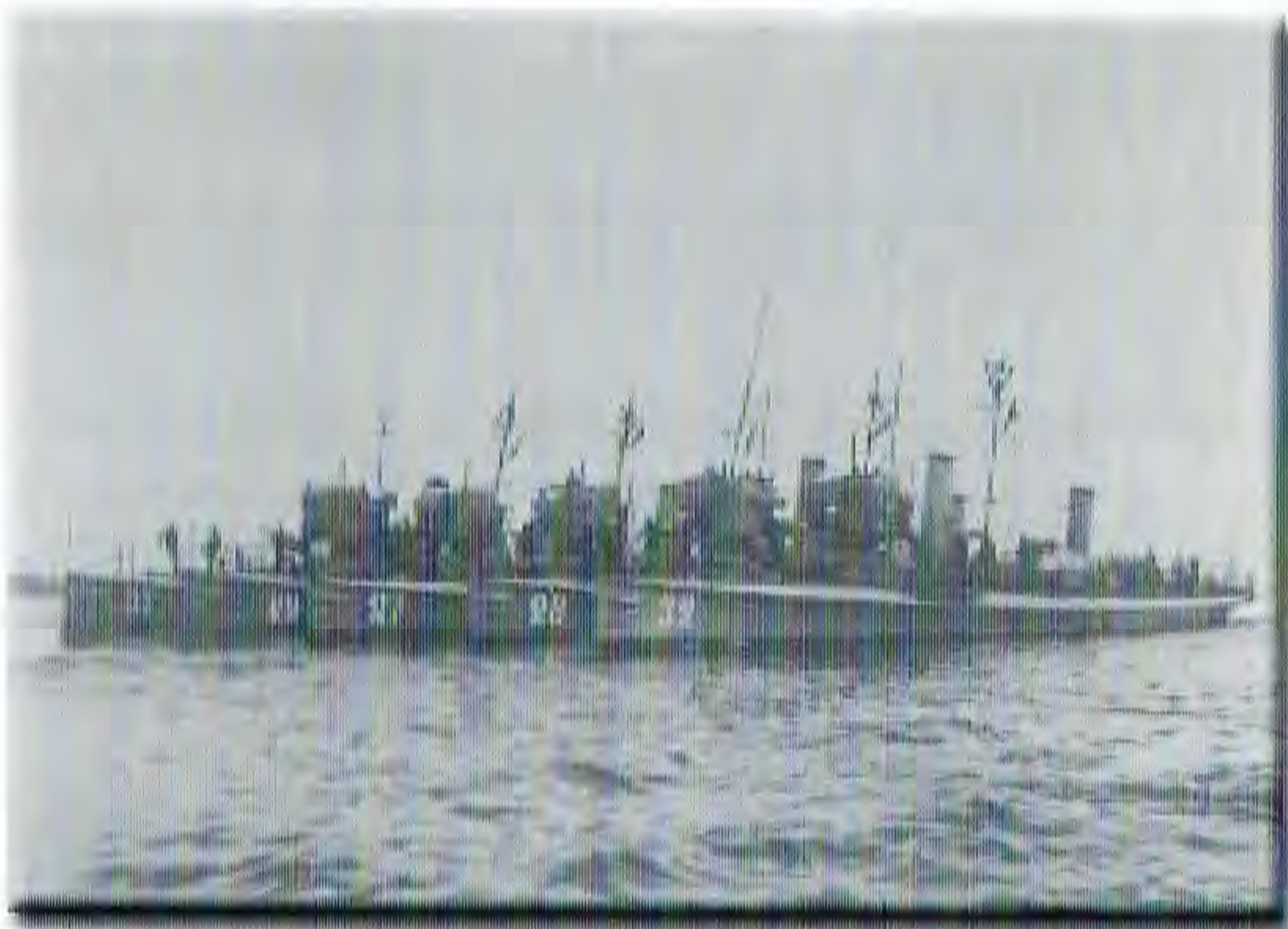
Minsvepningsdivisionen besöker Kiel sommaren 1905

Kamratföreningen Wiggan, en sammanslutning av Sthlms minunderofficerare, har efter 90 verksamhetsår upphört.