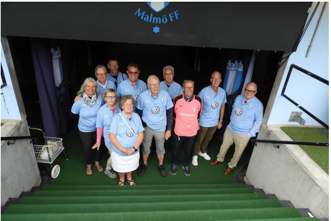
Vi var ju 11 som var med på guidningen, ett komplett lag. 10 utespelare i 1 målvakt!