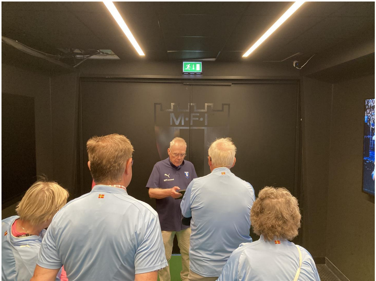
Medan MFF-hymnen spelas öppnas portarna och hela vårt "lag" träder in på planen under stort jubel.