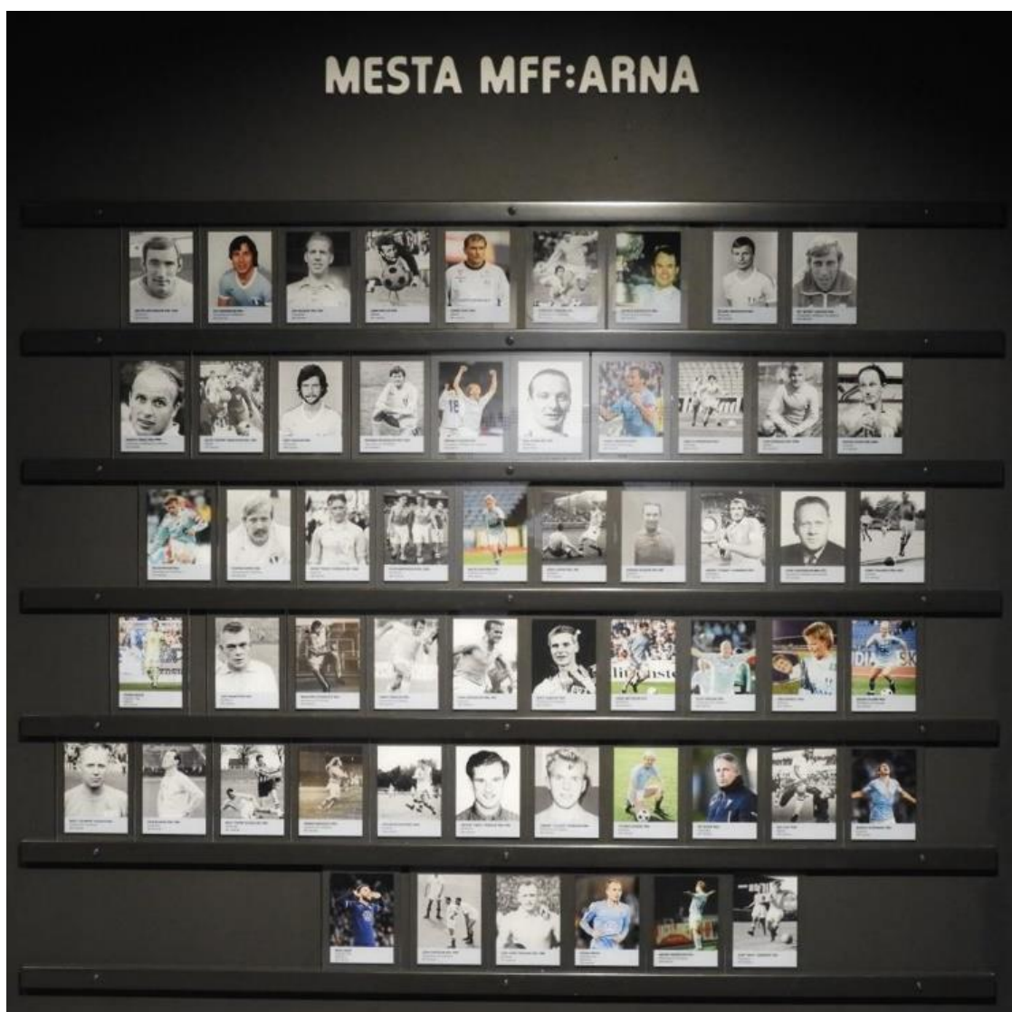
Bilder på de som spelat minst 300 matcher för MFF.