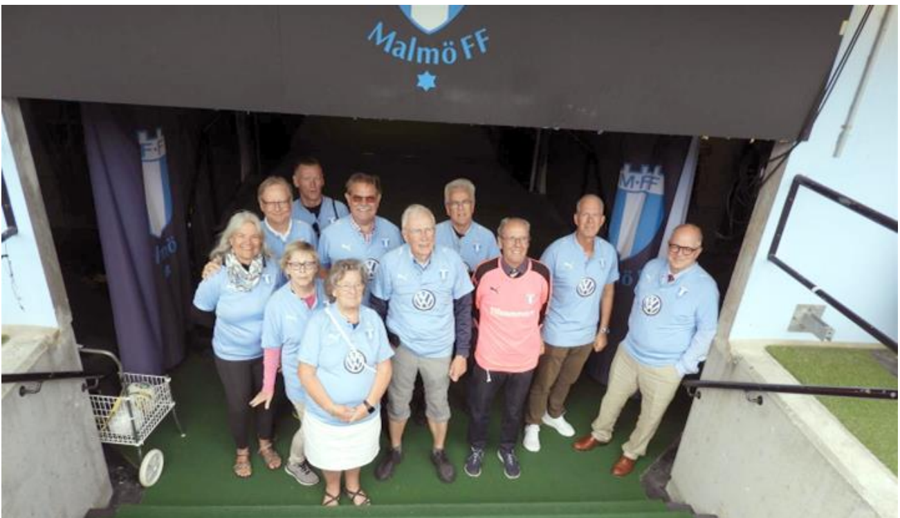
Alla vi på väg in till planen via spelarnas ingång.