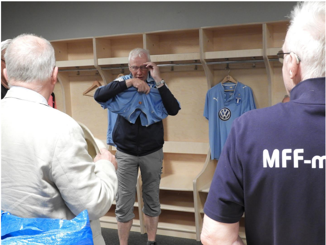
Vi tar på oss MFF:S matchtröja i motståndarlagets omklädningsrum och går sedan ut i spelargången.