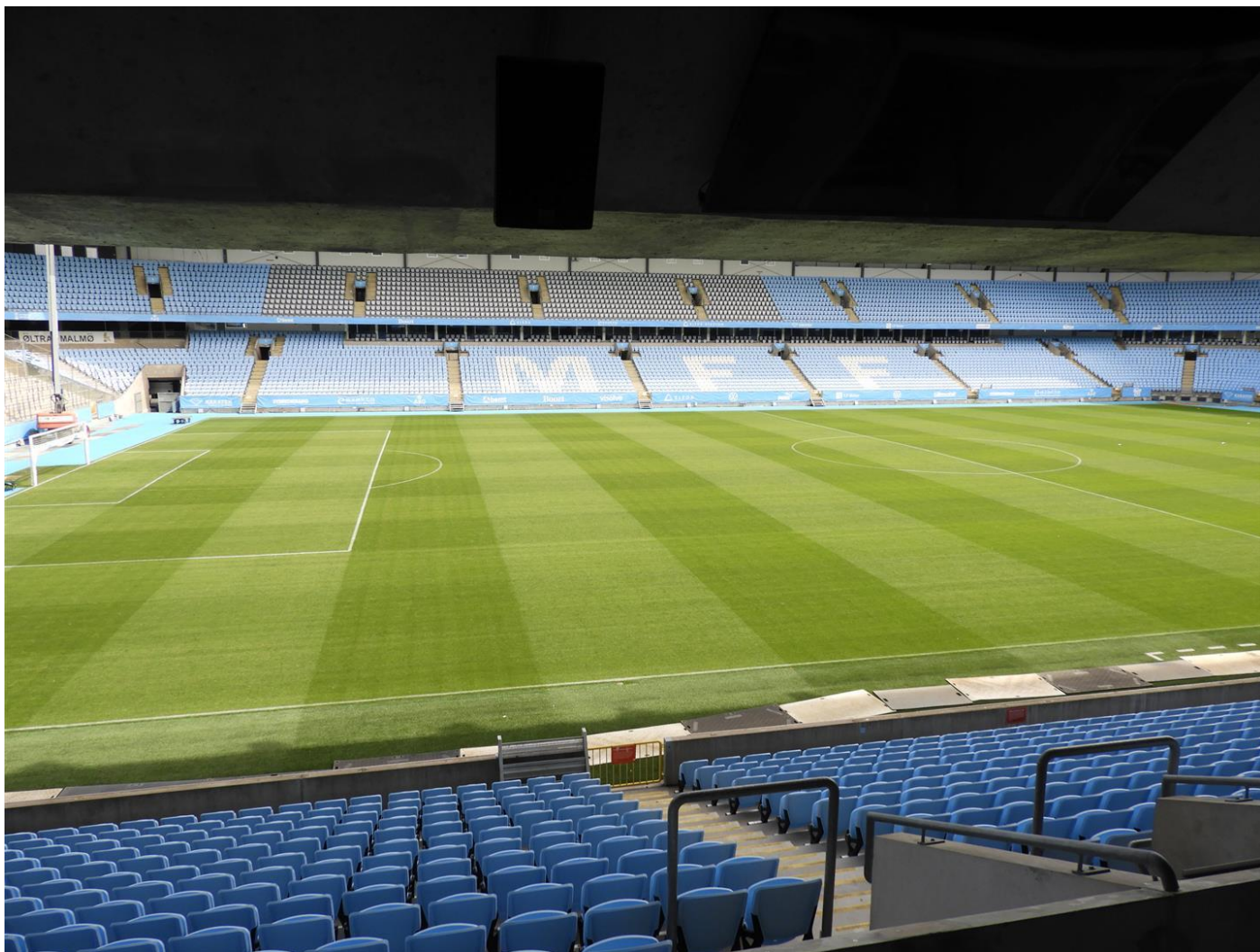
Den fina planen med riktigt gräs. Inget konstgräs!