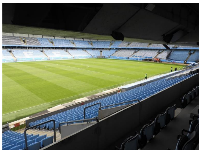
Till vänster Norra läktaren, MFF-supportrarnas läktare.