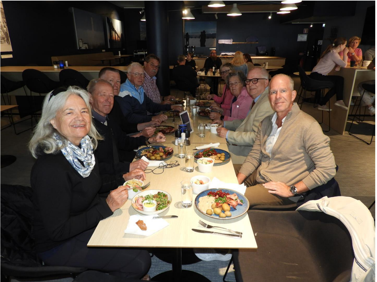
Först lunch i restaurang Erics inne i stadion.