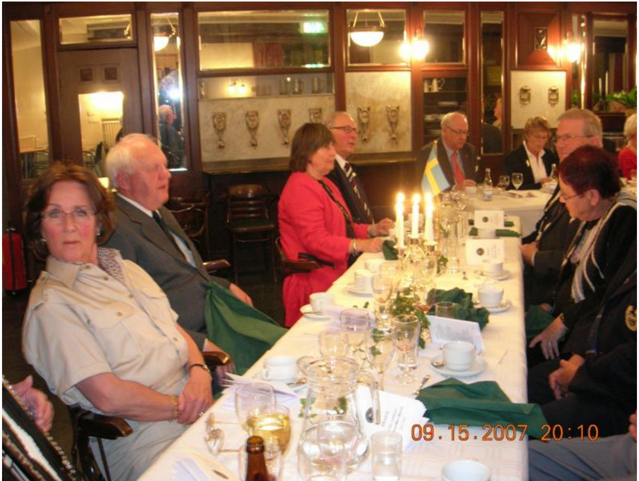
Gästerna vid de olika borden: