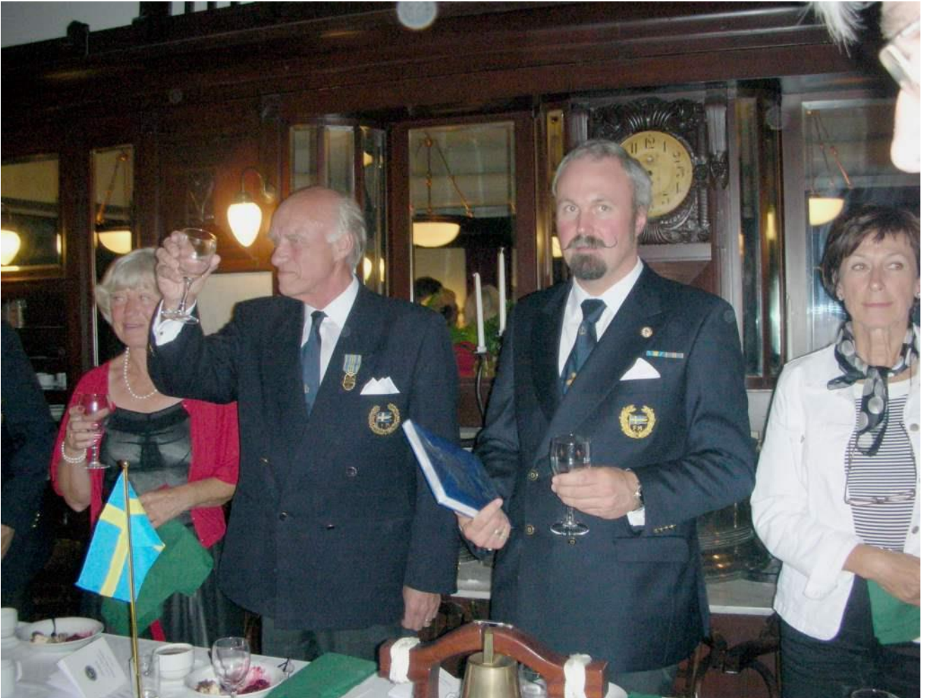
FM Malmö's Ordförande utbringade skålen för frånvarande kamrater (absent friends) och höll tal.