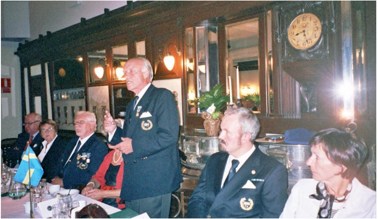
FM Riksförbunds Ordförande överlämnade Svenska Marinens högre chefer, och talade.