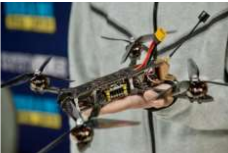
"Vår" Race Drone FPV är konstruerad för hastighetstävlingar. I taktiska sammanhang flyger de snabbt över trädtopparna och är mycket svåra att skjuta ner.