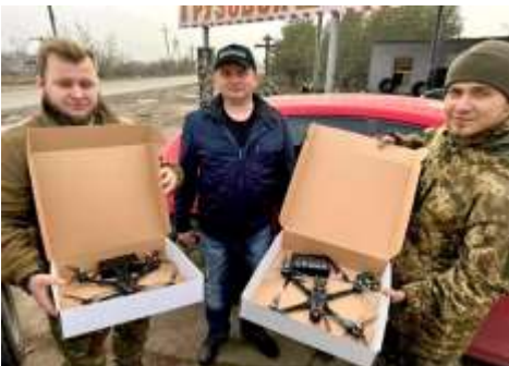
Drönarna levereras nära stridsfältet och överlämnas här till 21.mekaniserade brigaden.

Drönare finns av olika storlek och komplexitet. Allt från stora flygplansliknande och mycket avancerade drönare med ett vingspann på upp till 15 meter, som kostar tiotals miljoner kronor, ner till rena leksaker för några hundra kronor. Det vi pratar om här är en Race Drone-FPV, som kostar cirka 5 000 kronor. Drönaren är mycket snabb och svår att skjuta ner. Den kan bära en nyttolast i form av en sprängladdning på 0,5–1 kg, tillräckligt för att sätta ett pansarfordon ur stridbart skick genom att sikta på luftintaget till motorutrymmet. Dessa drönare kan verka på ett avstånd mellan 5–10 km.