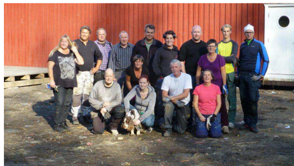
Entusiastiska gänget som slöt upp till Nyckelskolan

11:e oktober var en extra aktivitet på Nyckelskolan för att ta bort ett trä däck och vi fick möjlighet att få ta vara på trallvirket för användning på Notholmen