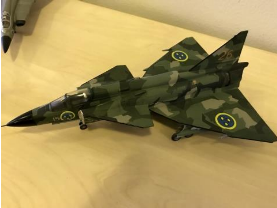
Viggen med sin fina kamoflagemålning