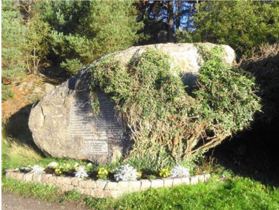
Minnesstenen på Märsgarn med namnen på alla som omkom

Därefter tog Hans över för att berätta om Flottans olika baser och annat utanför Stockholm som t.ex. Märsgarn, Berga, Muskö, Gålö och Älvsnabben. Intressant att åter få höra om dessa, för oss så mytomspunna, platser där flera av oss tillbringat en del av sin värnplikt eller tjänstgöring.