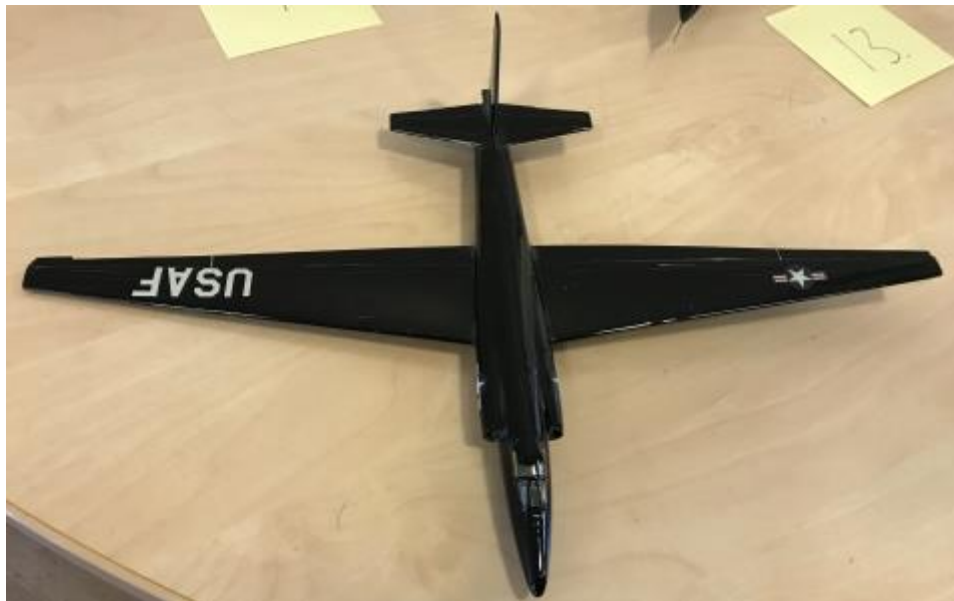
Lockheed U2 Dragon Lady

Vi fick också se en modell av det mytomspunna spionplanet Lockheed U2 Dragon Lady. U 2 är fortfarande i tjänst trots att typen har mer än 60 år på nacken.