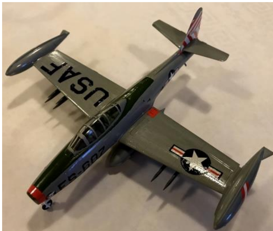
Republic P-84 Thunderjet